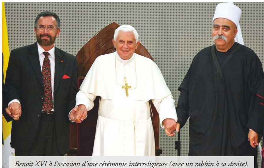
Benoît XVI à l'occasion d'une cérémonie interreligieuse (avec un rabbin à sa droite). De tels actes sont l'expression (et la cause) spectaculaire d'une nouvelle doctrine.