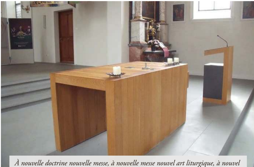
À nouvelle doctrine nouvelle messe, à nouvelle messe nouvel art liturgique, à nouvel art liturgique nouvel autel, etc.

L'exhortation pontificale Amoris lætitia du 19 mars 2016, consacrée au mariage, ne cesse d'entraîner des réactions diverses et des interprétations contraires.