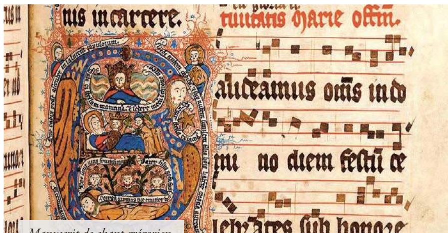
Manuscrit de chant grégorien

L'article précédent l'évoquait parfaitement : le concile Vatican II a introduit dans l'Église une nouvelle religion, avec ses nouveaux dogmes, son nouveau catéchisme, son nouveau code, sa nouvelle morale, ses nouveaux saints, sa nouvelle liturgie, ses « nouveaux cantiques dégoûlant de sentimentalisme ». Retour sur la musique.