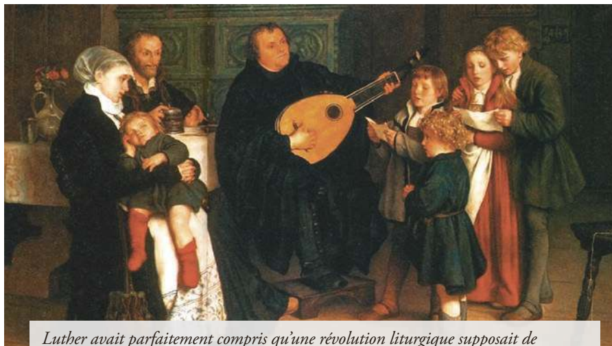
Luther avait parfaitement compris qu'une révolution liturgique supposait de « réformer » la musique et le chant ; les modernistes ne s'y sont pas trompés non plus.

À l'inverse, pour connaître à quel point une polyphonie est digne de