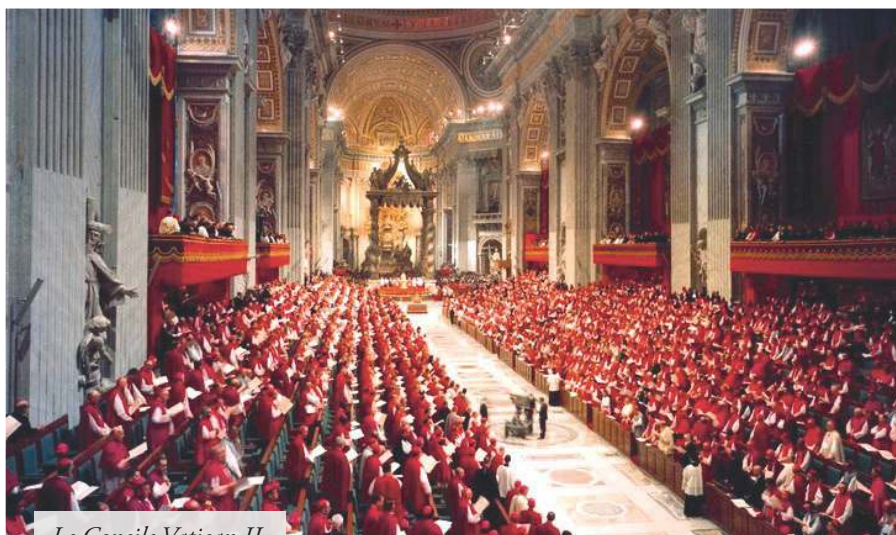
Le Concile Vatican II

sanctification des catholiques mais à des péchés de sacrilège eucharistique et à une dévalorisation du mariage chrétien. Inutile d'établir une litanie malheureuse, le pouvoir de gouvernement conciliaire manifeste une telle intention habituelle de modernisme et de libéralisme qu'elle jette un profond discrédit sur l'ensemble des actes de juridiction auquel il apparaît imprudent de s'estimer tenu.