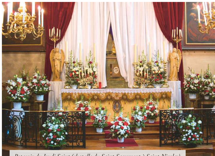
Reposoir du Jeudi Saint (chapelle du Saint-Sacrement à Saint-Nicolas)

Parfois les pantins arboraient le dessin du bicorne, de la redingote, ou des boutons rouges des Suisses en souvenir de la garde suisse qui suivit le pape Pie VI dans son séjour à Valence (non loin de chez nous) en 1798-1799, où il mourut prisonnier du Directoire. Pour nous, la cérémonie des Rameaux était alors une véritable éducation à la sainteté, car il fallait résister à la tentation de trois péchés capitaux : l'orgueil et l'envie d'abord, parce que chacun guettait qui avait apporté le plus beau rameau, la gourmandise ensuite parce qu'il fallait attendre la fin de la messe pour déguster ces bons biscuits – et la messe des Rameaux, avec la lecture de la Passion, était très longue !... Nous ne connaissions pas encore le païen Tantale, mais nous vivions son supplice, religieusement, sans nous plaindre... À la sortie de la messe, nos pantins étaient parfois manchots ou culs-de-jatte, mais dans l'ensemble à peu près présentables, car nous avions subi l'épreuve avec sagesse et nous