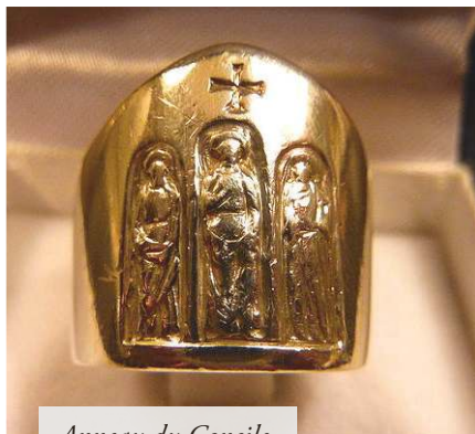
Anneau du Concile

L'Église d'aujourd'hui est bien une « Église conciliaire » et le but principal qu'elle recherche c'est l'enracinement des principes de Vatican II dans la vie de tout chrétien. Pour prendre une comparaison bien moderne, on pourrait dire que le concile Vatican II a été le Tchernobyl de l'Église, que tout dans l'Église a été irradié par les erreurs libérales du Concile et tout ce qui est depuis officiel dans l'Église est devenu radioactif... ! Gare à celui