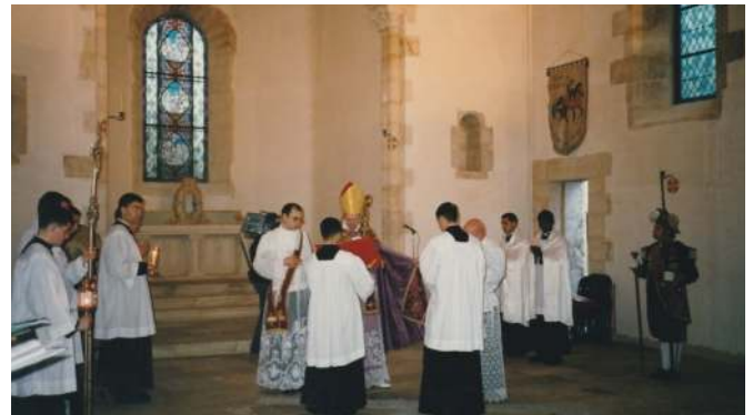
Après avoir purifié l'église, l'évêque va en prendre possession au nom de Celui qui est l'alpha et l'oméga, le commencement et la fin de tout, en traçant avec l'extrémité de la crosse le double alphabet grec et latin sur une croix de cendres.