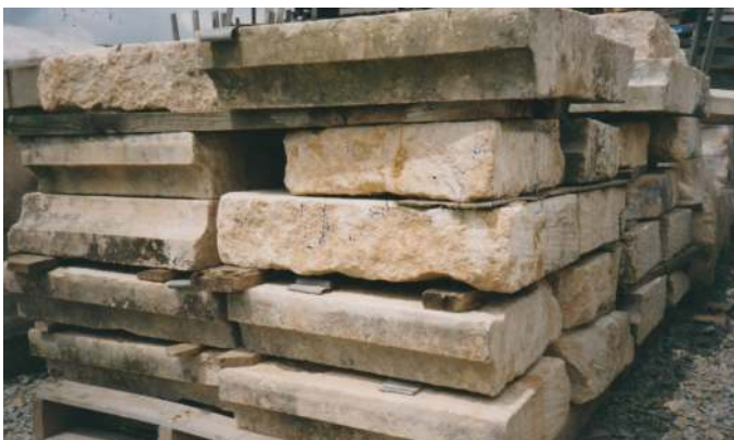
Les 220 tonnes de pierres numérotées et entreposées sur palette