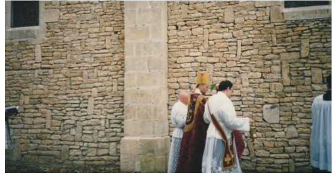
L'évêque purifie les murs extérieurs de l'église en les aspergeant d'eau bénite. Il fera de même sur les murs intérieurs.