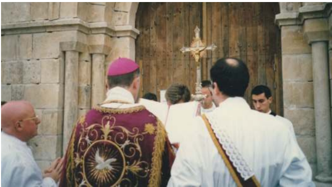
« Elevez vos portes, ô princes, élevez-vous, portes éternelles et le roi de gloire entrera. »