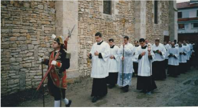
Le 11 novembre 1997, 8 heures La procession ouverte par un suisse, formée de nombreux prêtres et séminaristes assistant Mgr Bernard Fellay, supérieur général de la Fraternité sacerdotale Saint-Pie X, fait le tour de l'église.