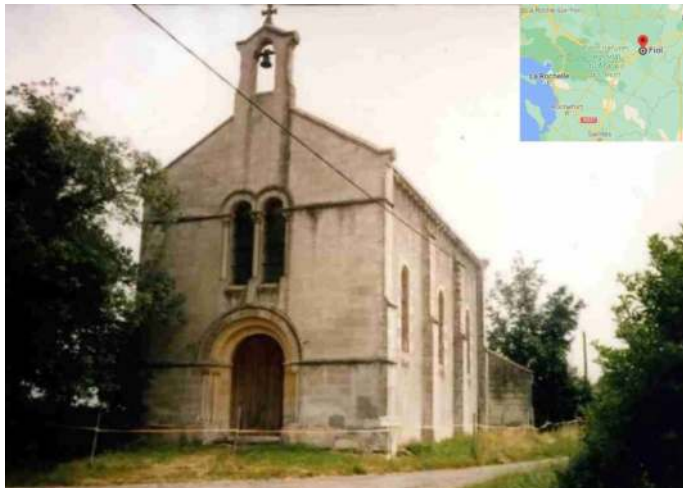
Eglise Saint-Martin de Fiol, dans les Deux-Sèvres de style néo-roman en pierre blonde du Poitou. Fut construite vers 1860 et démantelée en 1992

D'abord la génération suivante n'est jamais identique