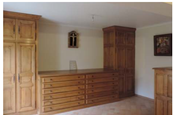
A droite : Agrandissement de la sacristie (2013)