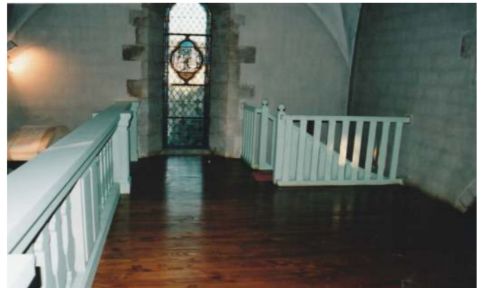
Installation de la tribune (2007)