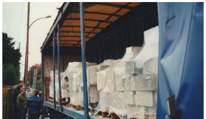
Le 30 septembre 1996 escorté par la police, un convoi de six semi-remorques livre les 220 tonnes de pierres de l'église