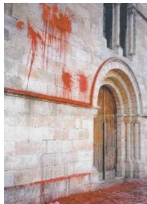
L'opposition à l'œuvre (veille de l'Épiphanie 2001)