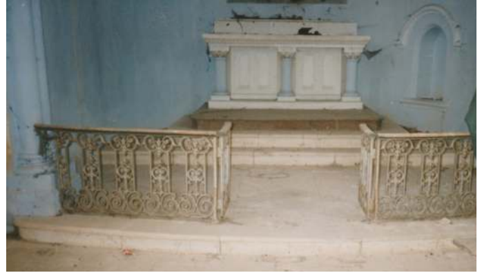
Le chœur de l'église Saint-Martin de Fiol