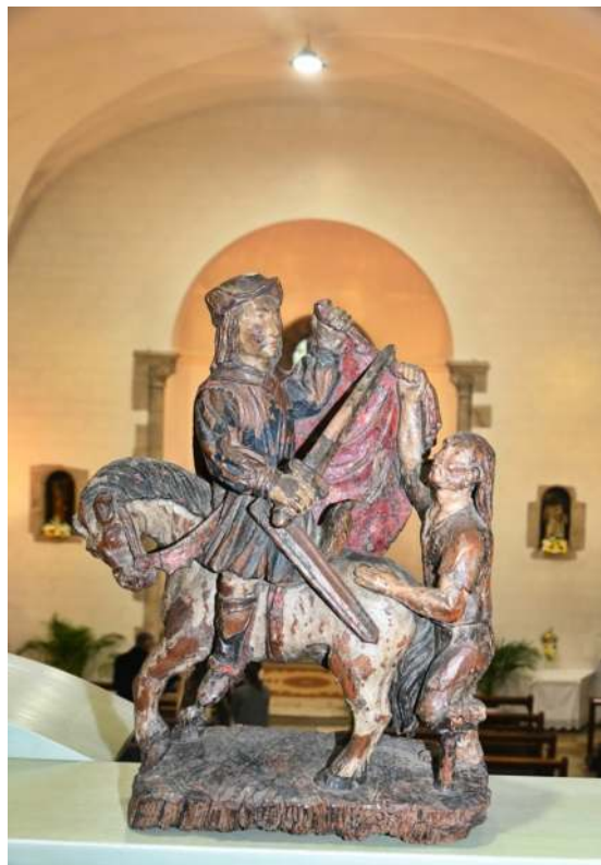
Saint Martin en bois polychrome

Laissons-donc là nos vaines inquiétudes tout comme nos présomptions, et cherchons simplement « le Royaume de Dieu et sa justice » (Mat. 6, 33), car tout le reste, y compris la transmission de la foi, nous sera donné par surcroît.