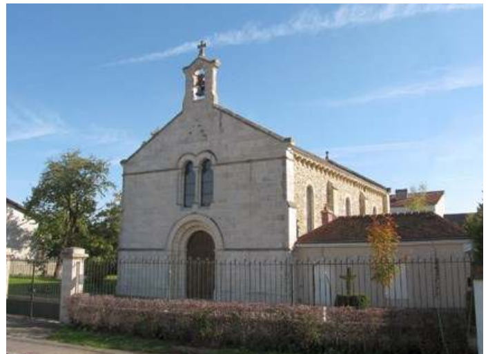
Eglise Saint-Martin-des-Gaules de nos jours

Cette mission, dans les temps actuels, prend de plus en plus l'allure d'un défi. Pourquoi ? Simplement parce que le monde (on le voit désormais avec une évidence grandissante), s'éloigne toujours plus vite de Dieu. C'est désormais année par année et presque mois après mois que s'enchaînent les lois destructrices de l'ordre naturel