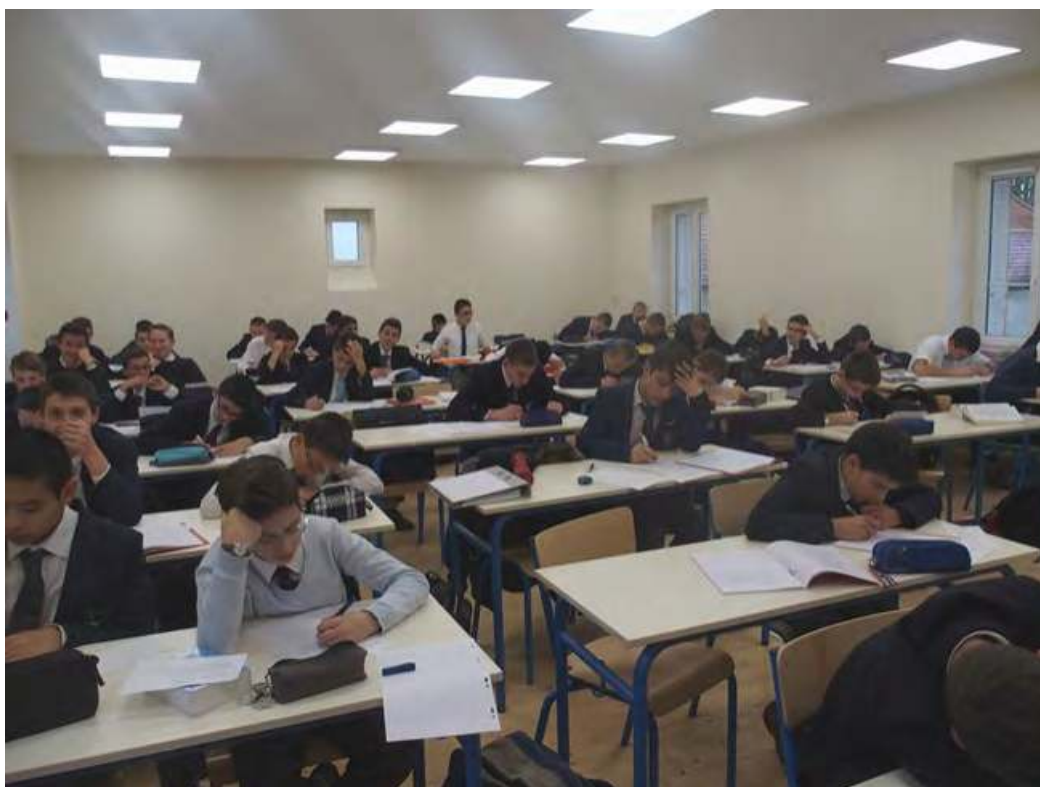
La nouvelle salle d'étude