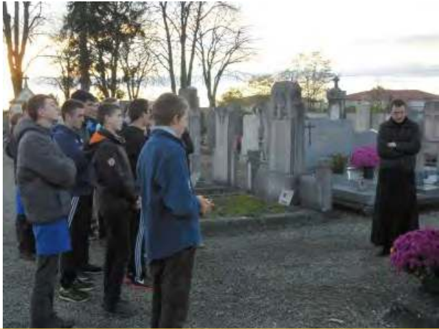
Prière au cimetière