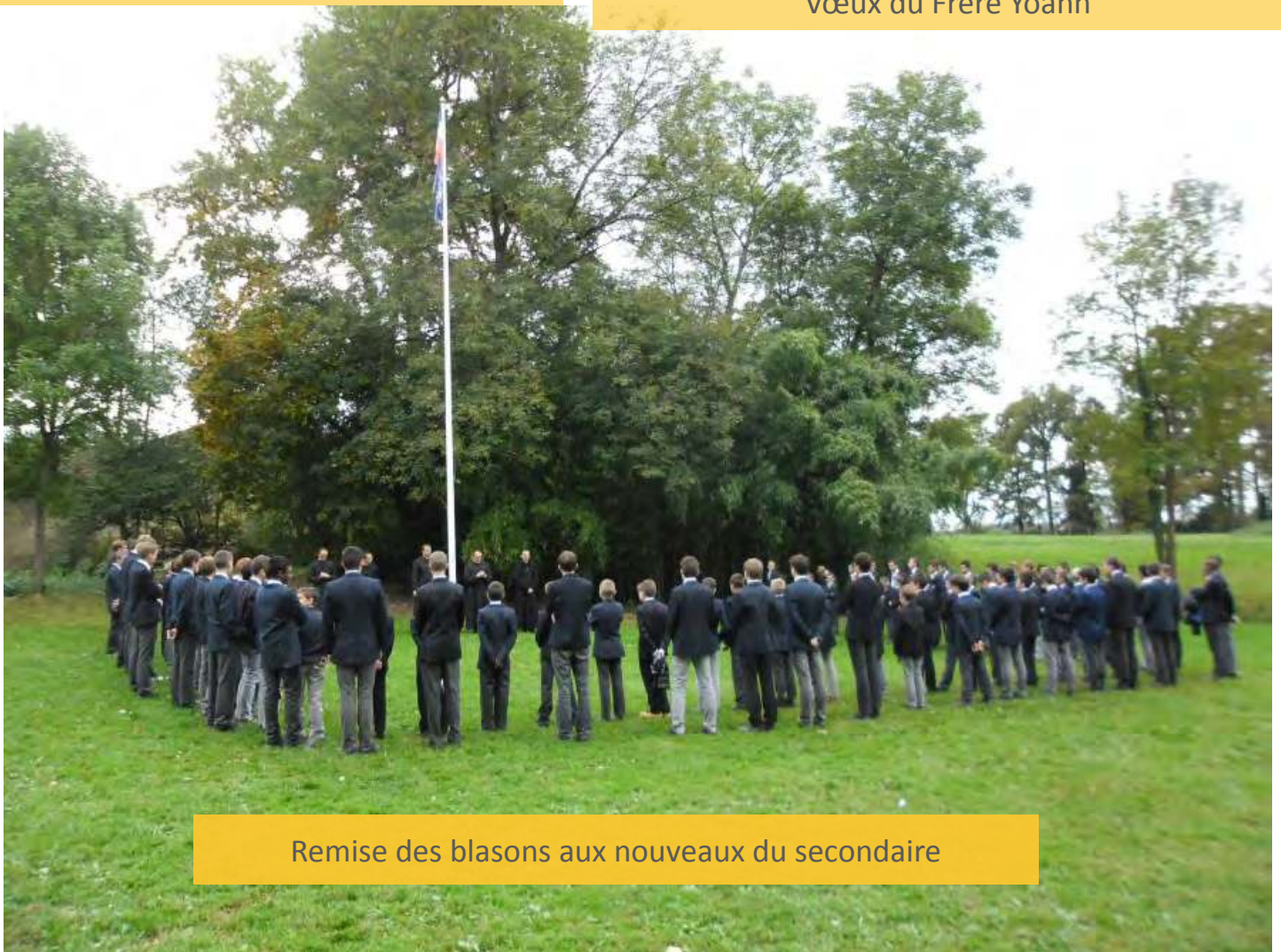
Remise des blasons aux nouveaux du secondaire