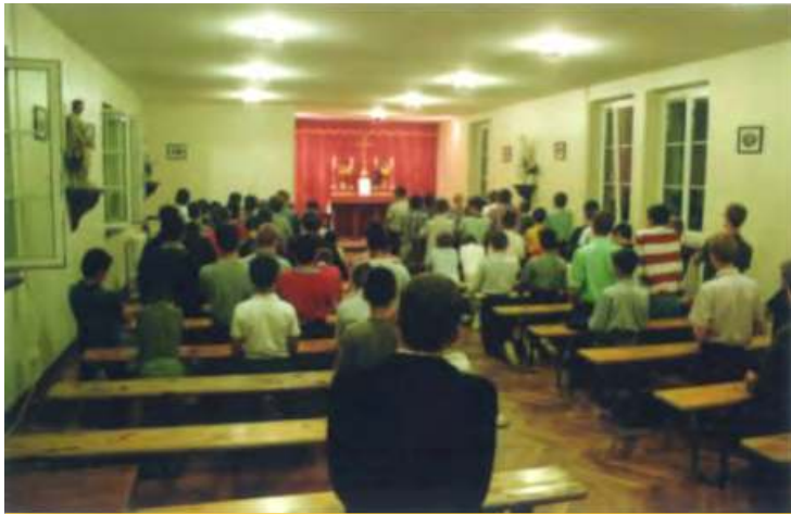
Prière du soir dans notre petite chapelle

écoles privées choisies par les parents pour des motifs bien étrangers à la foi : moyen d'échapper à la carte scolaire, encadrement plus sérieux, moins de grèves des enseignants, voire sélection du milieu