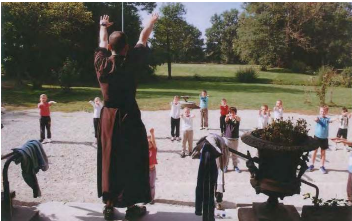
Ceci n'est qu'un simple cours de sport en CE