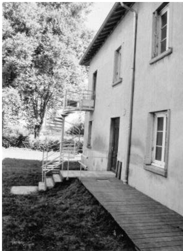
Escalier de secours de la salle d'étude