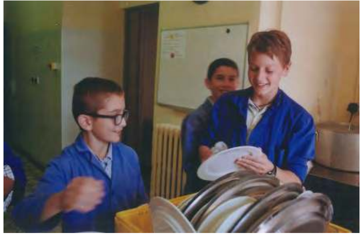
Personne n'y coupe...