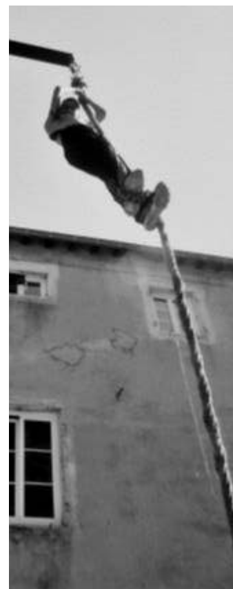
Vu de haut !