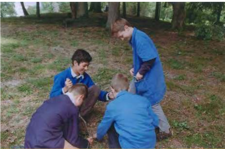
Préparation de munitions : des glands !