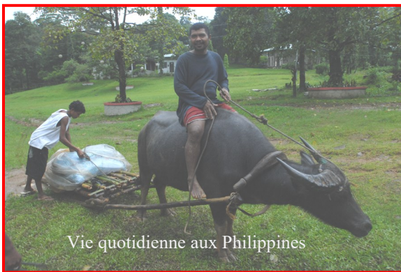
Vie quotidienne aux Philippines