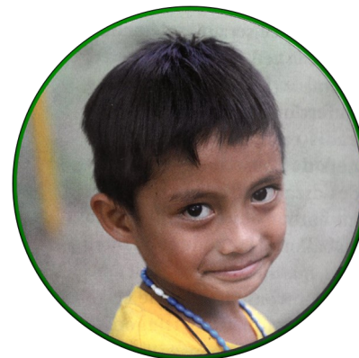
À la mission...

d'Asie, près de la Chine, mais ils n'ont pu réussir à convertir tous les habitants de ces 7107 îles ! Et en 1991, il reste encore des zones païennes, comme