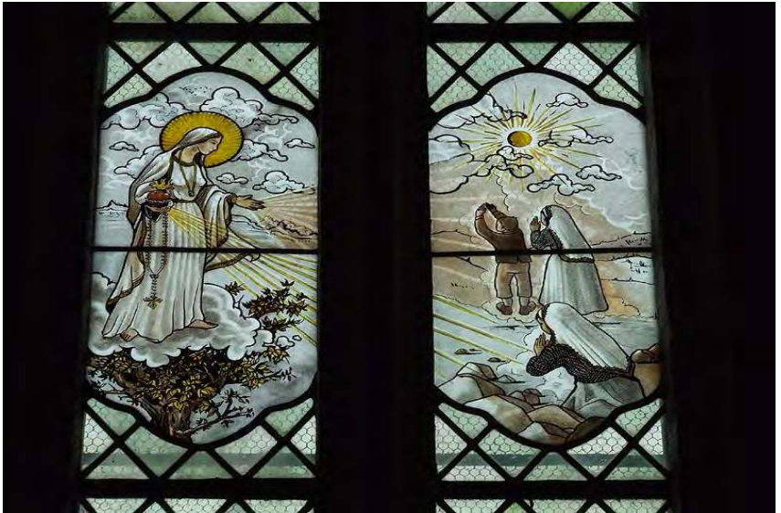
Vitrail de l'église d'Etais-la-Sauvin (Yonne)