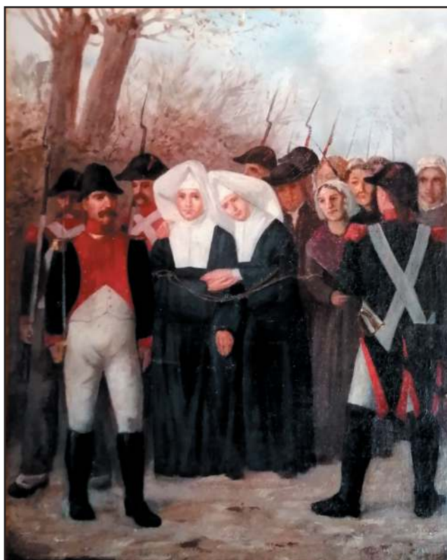
Les martyrs d'Avrillé. Tableau provenant de l'ancienne église Saint-Gilles d'Avrillé (collection privée).

À l'aube de la Révolution, l'Anjou se montre d'abord favorable. Mais le 12 juillet 1790, le vote de la Constitution civile du clergé provoque l'anxiété. Pour la faire accepter, le pouvoir impose un serment aux prêtres, le 27 novembre 1790. Ceci entraîne un grand mécontentement. Le 10 mars 1791, le pape condamne ces mesures schismatiques. Le clergé et les fidèles sont divisés. Le 14 août 1792, tous les français doivent prêter un nouveau serment de Liberté-Égalité . Les « bons prêtres » se cachent pour continuer à célébrer la messe et distribuer les sacrements. Par une loi du 26 février 1793, ceux qui les accueillent sont punis de six ans de fers. Mais ce qui provoque l'insurrection, dans les Mauges, c'est l'enrôlement prévu de 300 000 hommes. Les Vendéens connaissent des victoires et des revers, de mars 1793 à l'écrasement de l'armée vendéenne à Savenay en décembre 1793. Début 1794, l'armée catholique et royale étant pratiquement anéantie, les colonnes infernales de Turreau mènent une répression systématique. C'est la Terreur. La guillotine est installée place du Ralliement à Angers. Elle fait 285 victimes depuis Jean-Michel Langevin, curé de Briollay, le 30 octobre 1793, jusqu'à Jacques Laigneau de Langellerie, aumônier des Carmélites, le 14 octobre 1794. Ce sont deux de nos bienheureux martyrs.