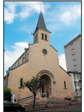
Église Saint-Charles-Borromée de Joinville-le-Pont