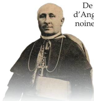
Mgr Joseph Rumeau, évêque d'Angers de 1898 à 1940

De son côté, Mgr Rumeau, évêque d'Angers, lui confère le titre de chanoine d'honneur de sa cathédrale.