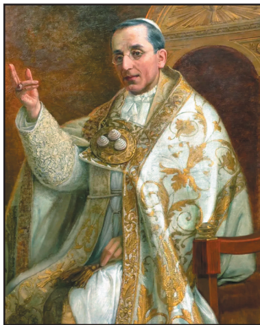
Benoît XV (tableau d'Emilio Vasarri)

Les éminentes qualités que vous avez manifestées avec éclat au cours de votre longue carrière sacerdotale Nous décident sans peine à vous honorer d'une illustre dignité. Nous savons, en effet, que vous vous acquittez de votre ministère sacré d'une manière exemplaire, que vous avez la plus vive sollicitude du salut éternel des fidèles et que vous affirmez avec constance et avec courage les droits de l'Église catholique — non sans péril pour votre vie — contre les sectes ennemies de la religion, enfin que vous n'épargnez rien, ni labeurs, ni dépenses, pour répandre dans le public vos ouvrages en ces matières. Puisqu'il en est ainsi, Nous vous conférons d'autant plus volontiers un témoignage de bienveillance que, comme vous venez de célébrer le cinquantième anniversaire de votre sacerdoce, Nos félicitations pontificales sont le couronnement des vœux de tous les gens de bien.