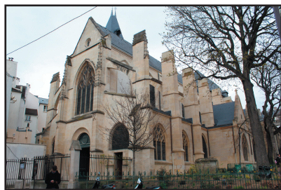
Église Saint-Médard, 5 e arrdt

le lendemain matin à une pauvre femme sans travail.