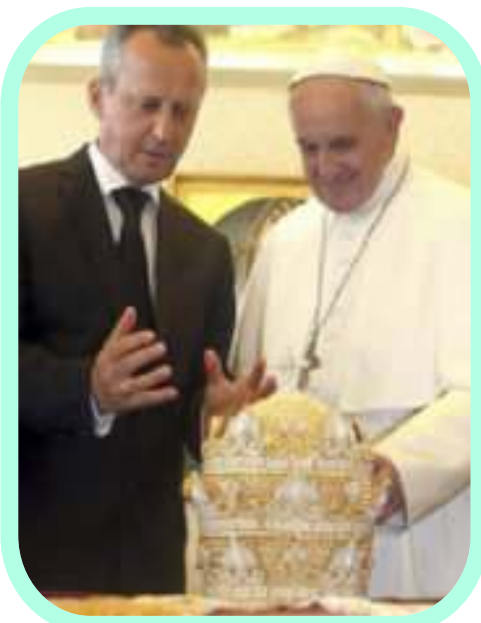
Le 16 mai 2016, le Pape François reçoit une tiare des mains du Président du Parlement de Macédoine

Judicieusement, il relève « la contradiction qu'il y a entre la démocratisation et la constitution divine de l'Église. Il y a une différence et même une opposition entre l'Église du Christ et les sociétés civiles. Celles-ci possèdent d'abord l'existence, et ensuite forment leur propre gouvernement... L'Église, au contraire, ne s'est pas formée d'elle-même, ni n'a formé son gouvernement ; elle a été faite toute entière par le Christ qui en a établi les lois fondamentales avant d'appeler les fidèles... L'Église est donc une société sans égale, où le chef est antérieur aux membres, et où l'autorité passe avant la communauté[5]. » La conclusion qui suit immédiatement est une condamnation très claire du projet du pape François : « Une doctrine, qui se fonderait sur le peuple de Dieu démocratiquement conçu et dans le sentiment et l'opinion du peuple de Dieu, est contraire à celle de l'Église. »