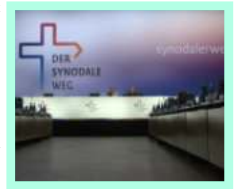
Synode allemand, le 11 mars 2023

Dans une page admirable de son ouvrage Iota unum , Romano Amerio note que « ces corps de l'Église appelés à la participation deviennent en réalité organes de dissension et d'indépendance du peuple de Dieu à l'égard de leurs pasteurs et du pasteur suprême. Ce que l'on prévoyait devoir rejaillir de la démocratisation de l'Église s'est