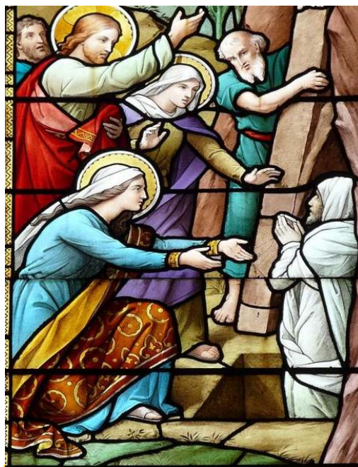
VITRAIL DE LA RÉSURRECTION DE LAZARE, ÉGLISE DE LA MADELEINE D'ANGERS.

Mais Jésus est prophète, quoiqu'en pensent ceux qui ne le comprennent pas et le blasphèment. Et voici ce qu'il répond à ces murmures pharisaïques : « En vérité, en vérité, je vous le dis, Israël, les âmes fidèles sont redevables à Dieu de grands privilèges. Bien plus redevables encore sont ceux qui, «assis autrefois dans les ténèbres et à l'ombre de la mort, ont été pardonnés, puis aimés autant que les premiers». Bien plus grands seront-ils, s'ils aiment en proportion de ce qu'il ont reçu de pardon et d'amour : « Vois-tu, ô pharisien, cette pécheresse méprisée ? »