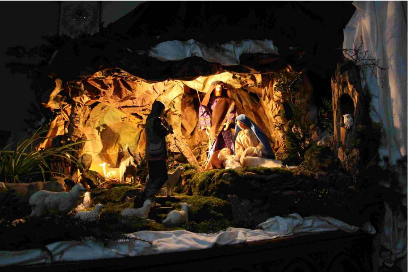
Les deux magnifiques crèches du prieuré de Gastines