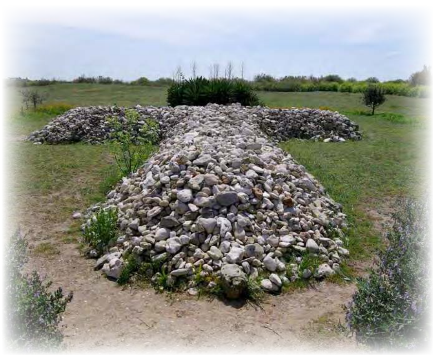
Croix des prêtres - Ile Madame

« Ceux qui auront suivi cette règle auront sur eux la paix et la miséricorde de Dieu. »