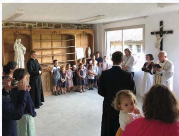
Bénédition de l'école le 19 septembre