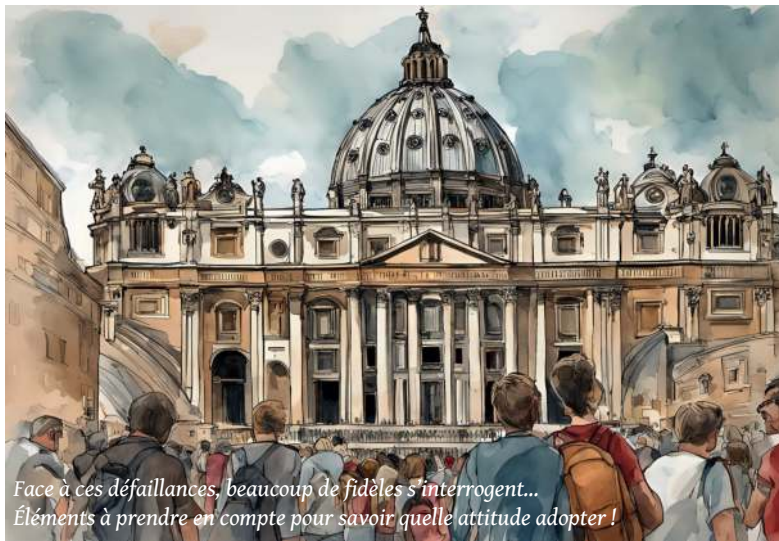
Face à ces défaillances, beaucoup de fidèles s'interrogent... Éléments à prendre en compte pour savoir quelle attitude adopter !

Cette primauté de la foi et des sacrements sur le gouvernement a été manifestée par Notre-Seigneur à ses Apôtres quand il leur a dit avant de monter au Ciel : « Allez, enseignez toutes les nations, baptisez-les au nom du Père et du Fils et du Saint-Esprit, et apprenez-leur à observer tout ce que je vous ai commandé. » (Mt 28, 19-20)