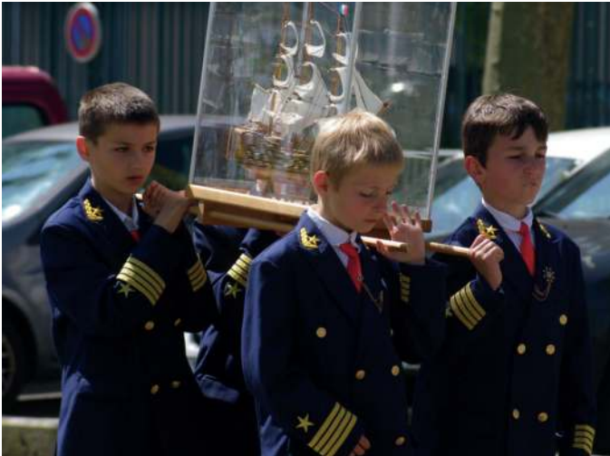
De très jeunes "officiers de marine" portent le brancard d'une maquette d'un bateau ex-voto.