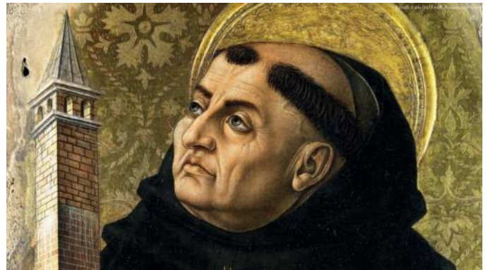
Que nous dit saint Thomas d'Aquin sur la défaillance possible des papes ? Et que nous en disent saint Augustin, saint Robert Bellarmin ?

Puisque tous ses actes ne sont pas garantis par l'infaillibilité, le pape peut se tromper. En effet, « l'Église, interprète de la divine Révélation, ne nous a jamais dit que nous soyons garantis, par une quelconque promesse divine, que le pape ne puisse jamais sortir du droit divin naturel et positif, et donc qu'il ne puisse jamais arriver qu'il mette la confusion dans le troupeau du Christ, qu'il le scandalise et tente même de détruire l'Église 4 . » Le grand théologien Thomas Cajetan (1469-1534), Maître général des Dominicains, cardinal, légat du pape auprès de Luther, commentateur de la Somme théologique , considéré par Léon XIII comme le commentaire de référence, assure qu'« il faut tenir tête à un pape qui déchirerait l'Église 5 . » Saint Robert Bellarmin (1542-1621), membre de la curie romaine, théologien du Saint-Office, conseiller du pape, archevêque de Capoue, l'affirmera à son tour 6 . Saint Thomas d'Aquin (1225-1274), considéré par l'Église comme le Docteur commun, tant il a brillé par sa science, écrivait déjà dans sa Somme théologique : « S'il y a un danger imminent pour la foi, les prélats doivent être contredits même en public par leurs sujets. Ainsi, saint Paul qui était un sujet de saint Pierre, l'interrogea publiquement à cause d'un pressant danger de scandale en matière de foi. Et, comme l'indique le commentaire de saint Augustin (354-430), "saint Pierre donna lui-même l'exemple à ceux qui gouvernent, afin