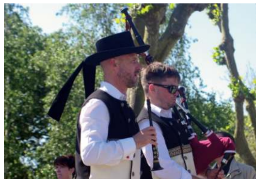
Le bagad Santa-Anna a travaillé, lors de nombreuses répétitions, pour préparer les cantiques de cette procession

De 1988 à 1990, il eut comme premier ministre la desserte hebdomadaire de la chapelle Sainte-Anne de Brest depuis le Prieuré Sainte-Anne de Lanvallay.