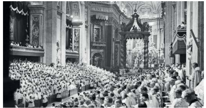
Ouverture du concile Vatican II. Les papes de la 1 re moitié du XX e siècle ont fermement condamné le modernisme et l'œcuménisme... Or ces erreurs ont pénétré progressivement à l'intérieur de l'Église.

Au cours des derniers siècles, de nouvelles erreurs ont contaminé les esprits au sein de la société civile au point de provoquer la Révolution de 1789. En réaction, les papes du XVIII e et du XIX e siècles ont condamné le naturalisme, le rationalisme et le libéralisme, et, durant la première moitié XX e siècle, le modernisme et l'œcuménisme... Or ces erreurs ont pénétré progressivement à l'intérieur de l'Église. Les papes l'ont déploré : Grégoire XVI (1765-1846) ( Mirari vos ), Pie IX (1792-1878) ( Quanta cura et le Syllabus ), Léon XIII (1810-1903) ( Libertas et Immortale Dei ), saint Pie X (1835-1914) ( Pascendi ), mais aussi Pie XI (1857-1939) ( Mortalium animos ), Pie XII ( Humani generis et Mediator Dei ). Citons simplement le grand pape saint Pie X. Dans son encyclique Pascendi , il dénonça le modernisme : « Les artisans de l'erreur, déplorait-il, se cachent dans le sein même et au cœur de l'Église, ennemis d'autant plus redoutables qu'ils le sont moins ouvertement. » Il précise sa pensée en parlant de « prêtres qui imprégnés jusqu'aux moelles d'un venin d'erreur puisé chez les adversaires de la foi catholique, se posent, au mépris de toute modestie, comme renouveaux de l'Église. » En 1909, le pape revient sur le sujet. « Quelques fils dénaturés veulent donner à l'Église une