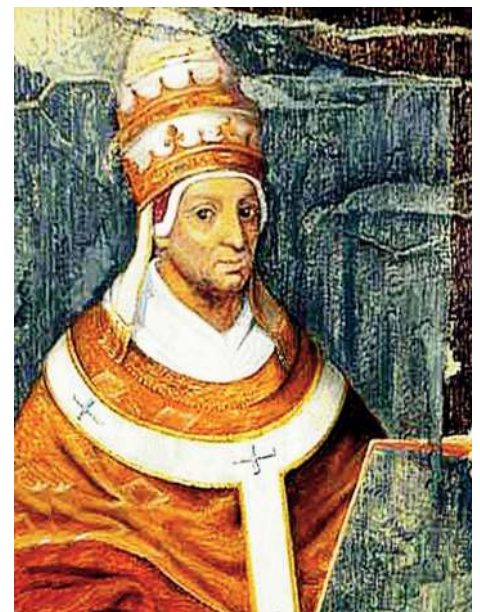
Le pape Jean XXII défendit une thèse erronée sur le sort des justes après la mort. Contredit, il dut renoncer à son erreur.

Ainsi le pape Jean XXII (1245-1334) soutint une doctrine erronée sur le sort des justes après la mort. Il pré-