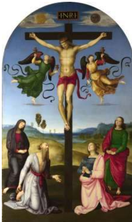
Crucifixion, Raphaël, 1503

Nous assistons, depuis déjà quelques décennies, à la déliquescence des institutions catholiques permise et encouragée par les autorités de l'Église elles-mêmes.