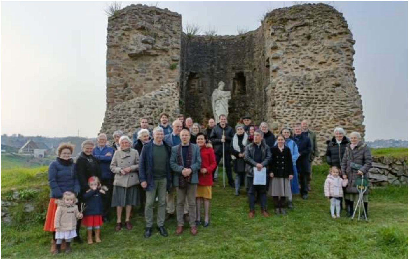
En ce samedi 19 mars, un groupe de pèlerins du prieuré est allé rendre hommage au grand saint Joseph sur les hauteurs du château de Léhon où se trouvent une statue et un autel dédiés au glorieux époux de la Mère de Dieu.

PELERINAGE DES PERES DE FAMILLE Samedi 2 avril 2022