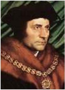
Saint Thomas More

"La joie chrétienne est un don de Dieu, qui découle d'une bonne conscience ; un cœur rempli de joie est plus facilement rendu parfait qu'un cœur triste". Saint Philippe Néri