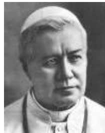
Saint Pie X

A quelqu'un qui lui demanda ce qu'était un pape, saint Pie X répondit : "C'est un cardinal qui a cessé de souhaiter la mort du pape."