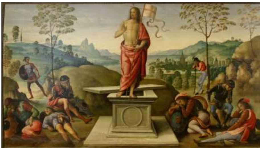
La Résurrection du Christ, Le Pérugin, Ca 1497