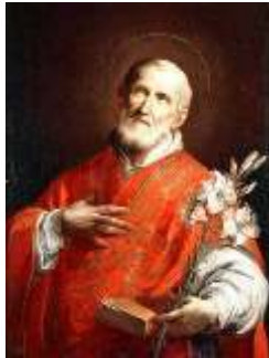
Saint François de Sales

Lorsqu'un jeune prêtre demanda à saint Philippe Néri quelle serait la prière la plus appropriée à conseiller à un couple après une messe de mariage, le saint répondit : "Une prière pour la paix."