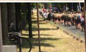
Quelques petits Bretons du chapitre enfants