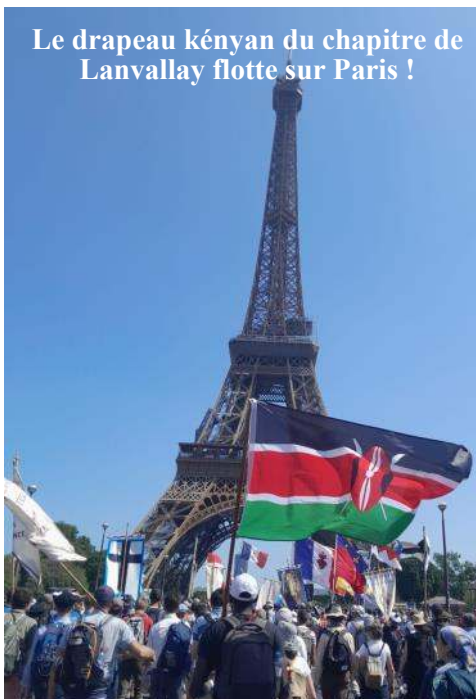
Le drapeau kényan du chapitre de Lanvally flotte sur Paris !