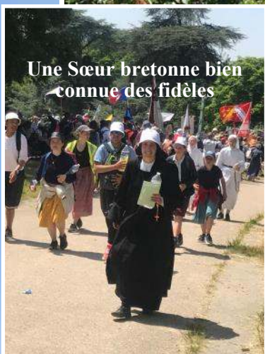
Une Sœur bretonne bien connue des fidèles