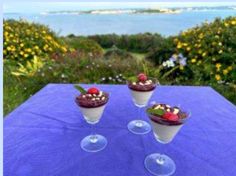
Un entremet estival qui peut se servir tant en entrée qu'en dessert, voire en

Cette photo devient précieuse puisqu'elle est un des derniers clichés de notre cher abbé avant son hospitalisation. Le Père Guyon a été très touché des marques d'affection et des prières de tous.