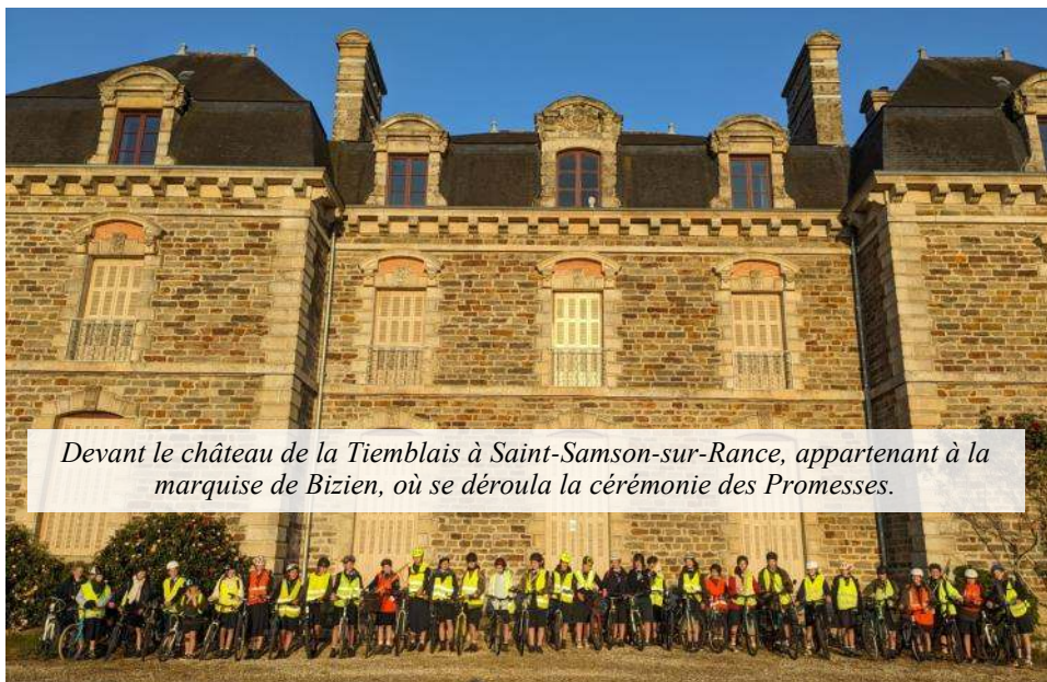
Devant le château de la Tiemblais à Saint-Samson-sur-Rance, appartenant à la marquise de Bizien, où se déroula la cérémonie des Promesses.

C'est alors que la chef d'équipage, dans un geste plein de sagesse et de bon sens, prit la décision de faire descendre tout le monde de son vélo. Enfin, nos guides sont toutes arrivées le dimanche matin, après avoir pédalé à vive allure afin de chanter la gloire de Dieu. Les parents furent soulagés de retrouver leurs enfants intacts, sans bras cassés ni chevilles foulées.