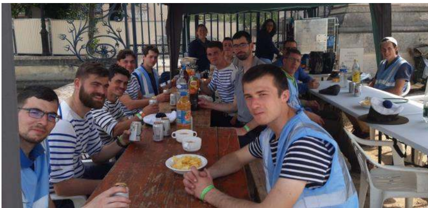
L'équipe de Diego désormais entrée dans la légende.

La fatigue se lit sur les visages mais c'est déterminée que la troupe des Louveteaux de Lanvallay entre à Paris le lundi de Pentecôte.