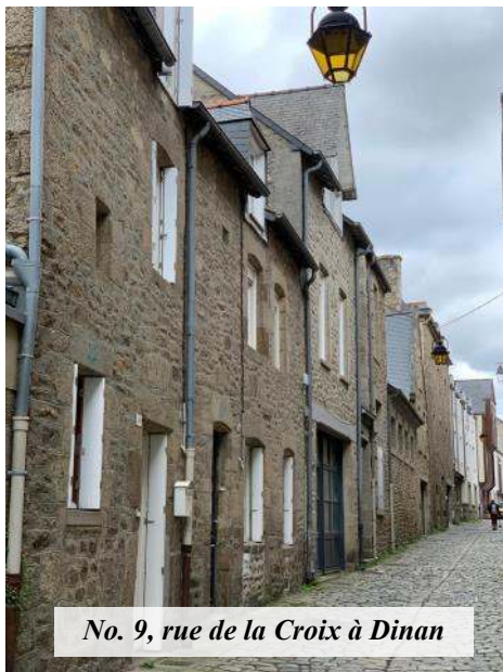
No. 9, rue de la Croix à Dinan

rencontra le comte et la comtesse de La Garaye qui demanderont en 1751 la venue des Filles de la Sagesse, ordre fondé par le saint, à Dinan. Ils donneront l'hôtel particulier qu'ils ont en ville dans l'actuelle rue de la Garaye pour installer la clinique de la Sagesse. Les religieuses posséderont la clinique jusqu'en 1974. Elle fut alors vendue et devint la Clinique du Pays de Rance. C'est dans l'hôtel par-