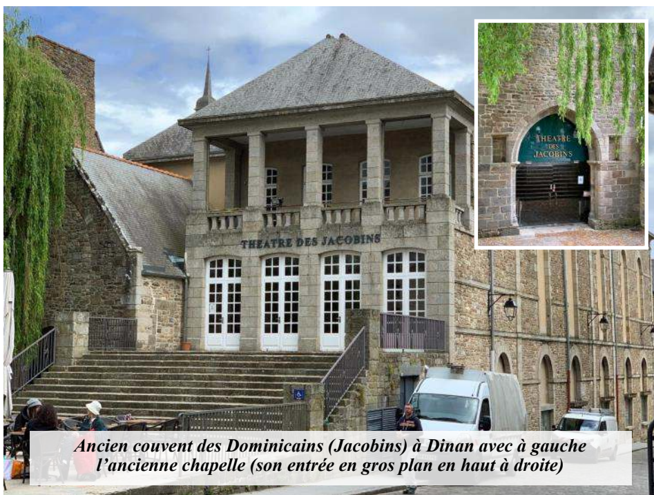
Ancien couvent des Dominicains (Jacobins) à Dinan avec à gauche l'ancienne chapelle (son entrée en gros plan en haut à droite)

Le sacristain est surpris d'être appelé "frère" alors qu'il est prêtre depuis