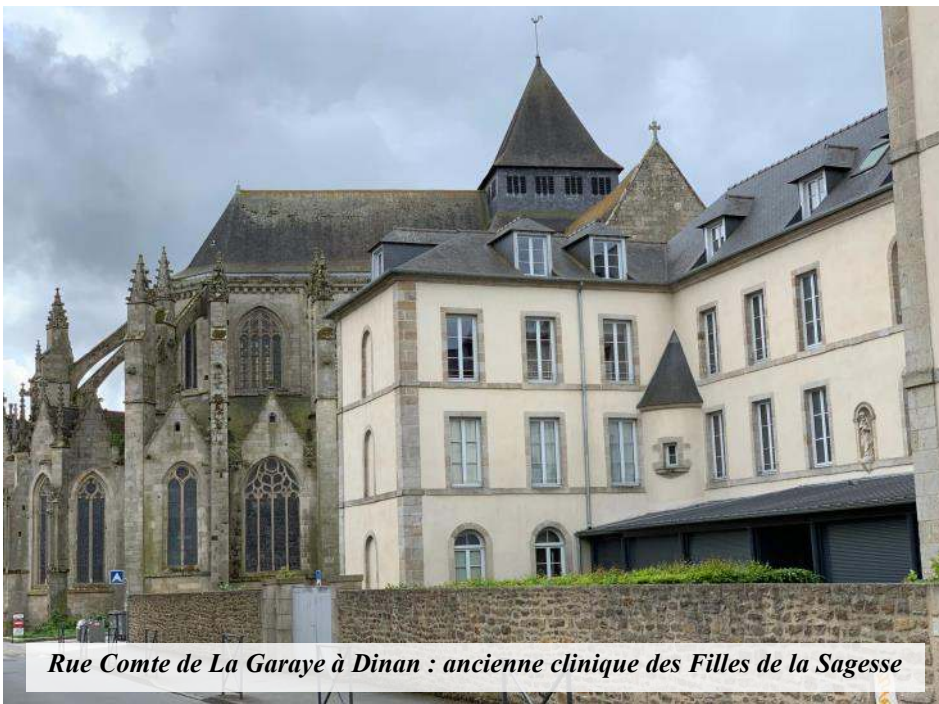
Rue Comte de La Garaye à Dinan : ancienne clinique des Filles de la Sagesse

huit ans et devrait être appelé "père". Il n'est pas du tout impressionné par ce prêtre et lui sort les ornements les plus pauvres qu'il peut trouver et deux petits bouts de cierges. Après la messe, Louis-Marie lui dit simplement :