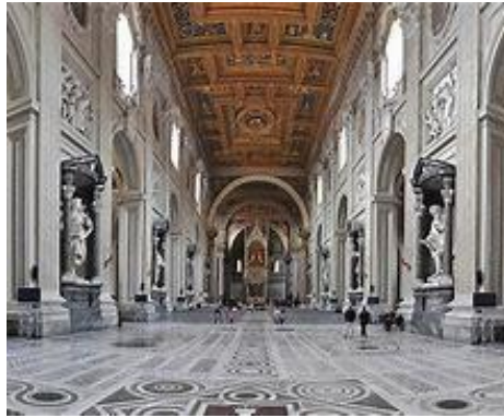
Nef de la Basilique ; en arrière-plan, le ciborium

stuc représentant des scènes de l'Ancien et du Nouveau Testament.