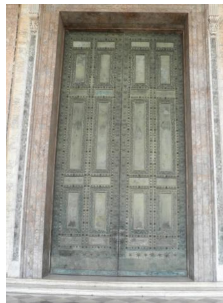
Porte centrale de la basilique

Depuis 1656 : la porte centrale est pourvue des battants de la porte de la Curie du forum .