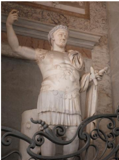
Statue de Constantin dans le Vestibule

Il comprend 5 portes, avec à droite la Porte Sainte ; à gauche, la statue de Constantin provient des thermes du Quirinal ; en haut, 4 bas-reliefs retracent la vie de saint Jean-Baptiste (imposition du nom par saint Zacharie, ses prédications sur les rives du Jourdain, reproche de l'adultère d'Hérode, sa décollation).