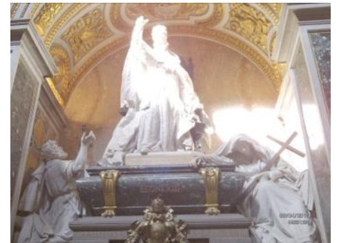
Tombeau de Léon XIII

Dans la salle du chapitre subsiste un témoignage des liens étroits qui unissent Rome à la France. En effet, depuis Henri IV, qui fit don à la cathédrale de Rome de l'abbaye de Clairac, le chef de l'Etat français est chanoine honoraire du Latran : il y a donc 2 stalles d'honneur : à droite celle du Pape est surmontée d'une colombe, à gauche celle du chef de l'Etat français est surmontée d'une statue de la Sainte Vierge. Depuis le XVII ème siècle, une messe est célébrée traditionnellement dans la Basilique, le 13 décembre (jour de naissance d'Henri IV), pour la prospérité de la France. Juste à côté, au-dessus de la porte de la sacristie, se trouve le majestueux tombeau de Léon XIII (1878-1903).