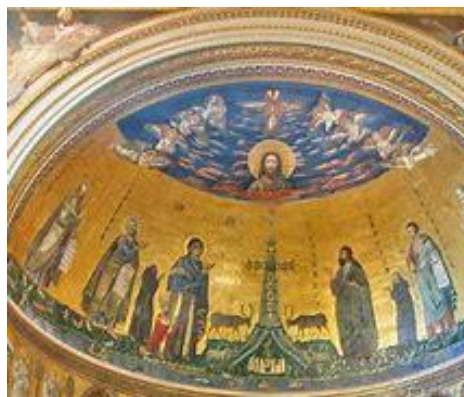
Détail de la mosaïque absidiale

bas de cette zone est occupé par le Jourdain couvert de figures d'enfants, de barques, de cygnes, de canards.