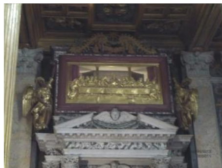
Chapelle du Saint-Sacrement – Détail du haut-relief et de la relique

A droite, se trouve un orgue baroque monumental, le plus ancien de Rome. A gauche, on peut admirer l'autel du Saint Sacrement : ses colonnes corinthiennes en bronze doré appartenaient au temple de Jupiter Capitolin ; au-dessus, derrière le bas-relief en bronze, est conservé un fragment de la table de bois sur laquelle Jésus institua l'Eucharistie.