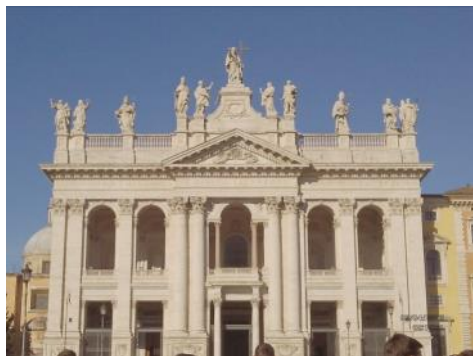
Façade de la Basilique

Le 9 novembre 2023, le cardinal Angelo De Donatis inaugurerait une année jubilaire pour la cathédrale de Rome, plus connue sous de la dénomination de Saint-Jean-de-Latran, en fournissant le programme spirituel, « conférenciel » et musical qui émaille cette année devant se clôturer le 9 novembre 2024, jour anniversaire de la Dédicace de la basilique.