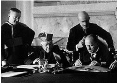
Signature des accords du Latran

Sauveur, Saint-Paul-hors-les-Murs, et Sainte-Marie-Majeure ainsi qu'à certains lieux comme la résidence papale de Castelgandolfo ou le palais de la Propaganda Fide .