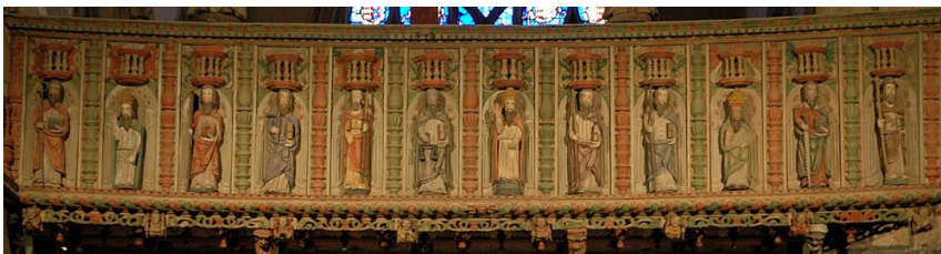
La Roche-Maurice - Soubassement du jubé

12 « L'arc de triomphe du Folgoët, [...] est soutenu, sur le devant, par quatre colonnes, et, en