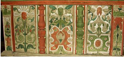
La Roche-Maurice – Panneau d'un des soubassements

soutenant la tribune. Côté nef, on retrouve les Apôtres avec également trois papes et côté chœur, on distingue saints Pol-Aurélien 15 , Idult 16 , Christophe, Michel, Marie-Madeleine, Notre-Seigneur, saintes Catherine d'Alexandrie, Barbe, Appoline 17 , saint Antoine du Désert, saintes Geneviève et Marguerite. Le jubé se prolonge sur les piliers l'encadrant avec sainte Anne et sainte Marguerite.