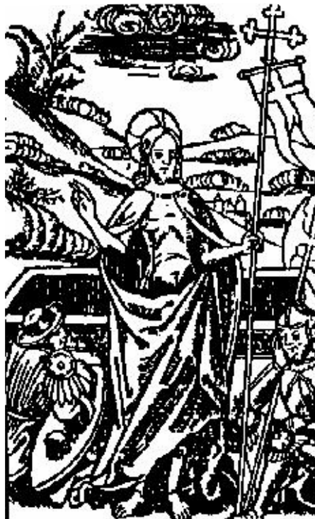
« Nous savons que le Christ est véritablement ressuscité d'entre les morts. Vous ô Roi victorieux, ayez pitié de nous. » Séquence de la messe de Pâques.

à attendre le salut, mais ce salut vient encore de lui : si " je lève les yeux vers les montagnes, d'où me doit venir le secours ", je ne l'attends pourtant pas des montagnes elles-mêmes, car " mon secours vient du Seigneur qui a fait le ciel et la terre ". Dans les détresses matérielles, Dieu peut me venir en aide par les hommes, mais ton salut, ô mon âme, ce n'est que lui.