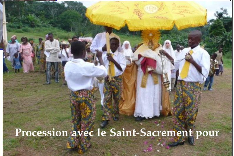
Procession avec le Saint-Sacrement pour

Desserte régulière depuis 1995. Aujourd'hui, Messe tous les dimanches assurée par les prêtres venant de Li-