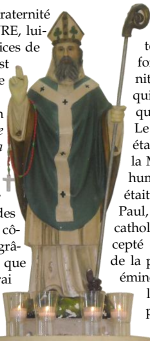
Saint Patrick de Four-

Merci à toutes les générosités qui ont permis et qui permettent encore par leur prière et par leur contribution matérielle le maintien de cette œuvre, grande et