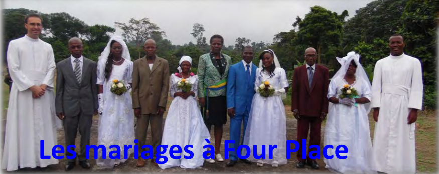
Les mariages à Four Place