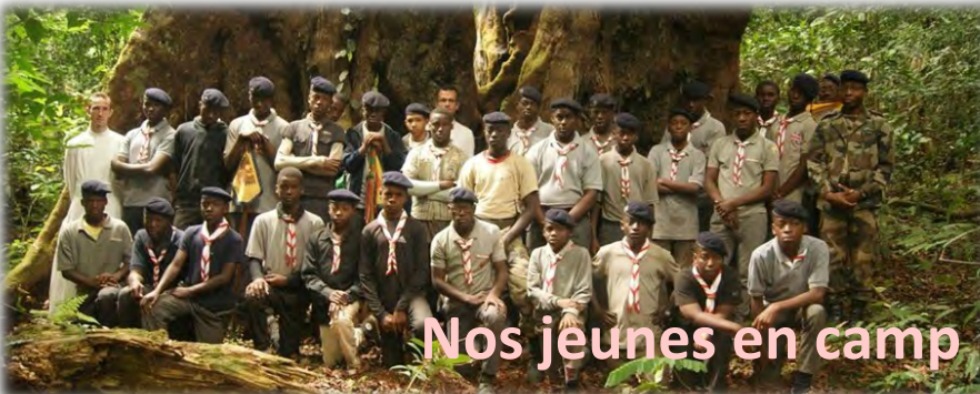
Nos jeunes en camp