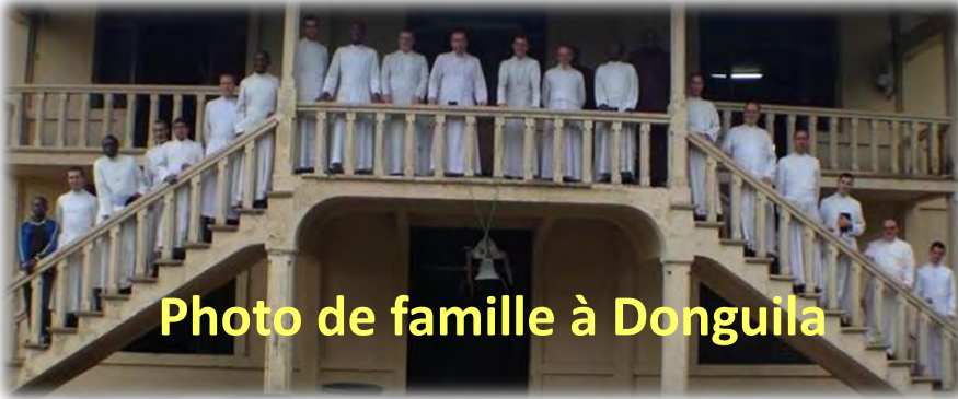
Photo de famille à Donguila