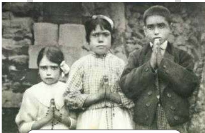
Les trois voyants de Fatima: Jacinthe, Lucie et François.

Je ne sais combien de fois nous avons répété cette prière lorsque