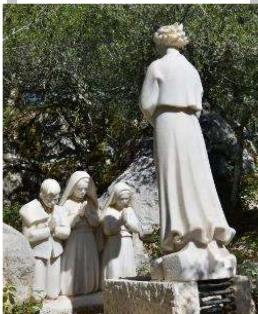
Les apparitions de l'ange aux trois enfants.

« Vous aurez alors beaucoup à souffrir, mais la grâce de Dieu sera votre réconfort ».