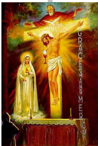
Les apparitions de Tuy

jusqu'au plafond. Dans une lumière plus claire on voyait sur la partie supérieure de la croix une tête d'homme dont on voyait le corps jusqu'à la ceinture; sur la poitrine une colombe également lumineuse et, cloué sur la croix le corps d'un autre homme . Un peu au-dessous de la ceinture de celui-ci, suspendu en l'air, on voyait un calice et une grande hostie sur laquelle tombaient quelques gouttes de sang qui coulaient le long du visage du crucifié et sortaient aussi d'une blessure de la poitrine. Coulant sur l'Hostie, ces gouttes tombaient dans le Calice. Sous le bras droit de la croix se trouvait Notre Dame (c'était Notre Dame de Fatima avec son Cœur Immaculé dans la main gauche, sans épée ni roses, mais avec une couronne d'épines et des flammes...) Sous le bras gauche, de grandes lettres, comme d'une eau cristalline qui aurait coulé au-dessus de l'autel, formaient ces mots « Grâce et Miséricorde ». Lucie comprit qu'il lui était montré le Mystère de la très Sainte Trinité. Ensuite Notre Dame lui dit : « Le moment est venu où Dieu demande au Saint-Père de faire, en union avec tous les Évêques du Monde , la Consécration de la Russie à mon Cœur Immaculé, promettant de la sauver par ce moyen ». Cette demande avait été annoncée par l'apparition du 13 juin 1917, dans ce qui était appelé alors le " SECRET DE FATIMA "