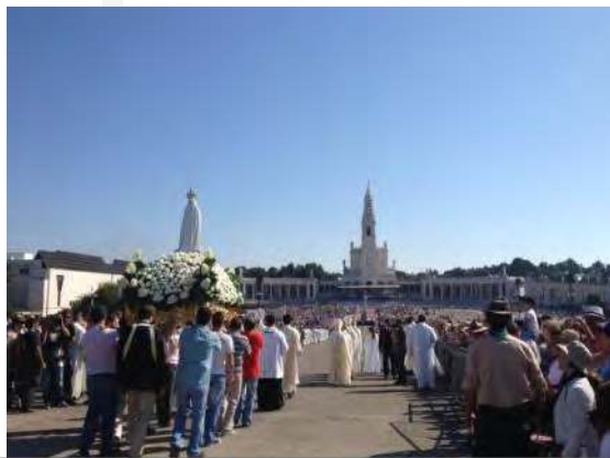
Le sanctuaire de Fatima aujourd'hui