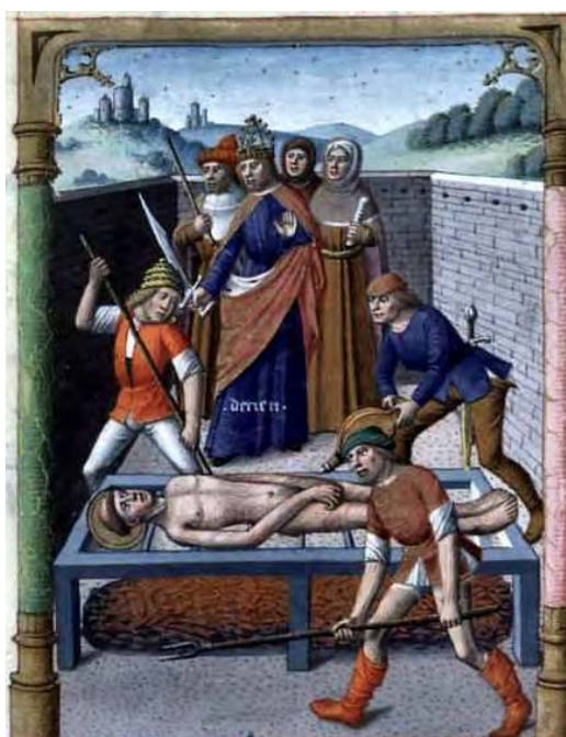
Martyre de saint Laurent

Evidemment, nul catholique digne de ce nom ne peut se réjouir du péché. Les larmes de contrition sont louables