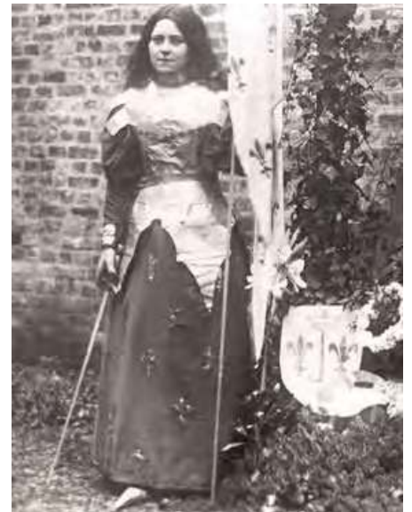
sainte Thérèse de l'Enfant-Jésus interprétant sainte Jeanne d'Arc au Carmel

regarde heureux au ciel, heureux au tabernacle, bon ou mauvais, quel que je sois, Vous êtes heureux, ô mon amour, rien ne peut Vous arracher votre bonheur, rien par conséquent ne peut m'ôter le mien » 2 .