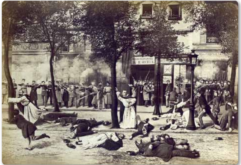
Martyre des dominicains d'Arceuil, 25 mai 1871

Le signal de l'insurrection est donné lorsque le général Lecomte est envoyé récupérer les canons de Paris, le 18 mars 1871. Il est massacré avec le général Clément-Thomas. Adolphe Thiers, président de