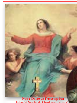
Notre Dame de l'Assomption Eglise St Nicolas du Chardonnet Paris (V)