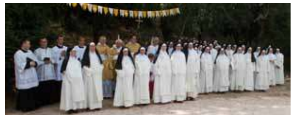
Professions perpétuelles à Saint-Pré, le 22 août.