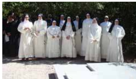
Prises d'habit et Premiers Vœux à Saint-Pré, le 3 août.