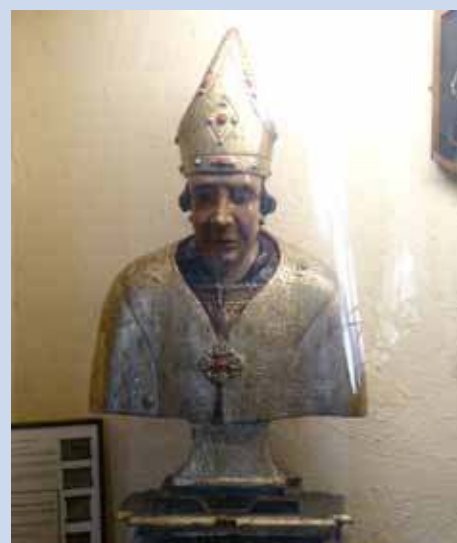
Buste-reliquaire de saint Véran, cathédrale Nativité de Notre-Dame, Vence

Au sixième siècle fut érigée une église Saint-Véran à Cagnes-sur-mer, près de Lérins, puis un monastère Saint-Véran en 1010.