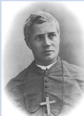
... évêque de Mantoue

En 1884, le pape Léon XIII le nomme, malgré sa répugnance, évêque de Mantoue. En