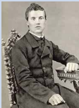
... jeune prêtre...

pour qu'il aille étudier au petit séminaire de Trévise, puis en novembre 1854 au séminaire de Padoue.