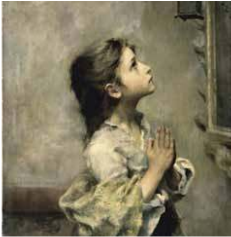
Enfant priant (détail) Roberto Ferruzzi (1853-1934)

quences narratives... font que le spectateur est tenu en haleine sans faire le moindre effort. C'est ainsi que la capacité à réfléchir ne cesse de diminuer. L'entreprise Microsoft a publié une étude qui montre que la capacité d'attention des hommes est descendue à 9 secondes en moyenne, et elle-même fait la comparaison avec les poissons rouges qui seraient capables de fixer leur regard pendant 8 secondes... Si les messages ne sont pas toujours plus incisifs et provocateurs, les hommes sont distraits par autre chose. Il faut sans cesse susciter leur at-