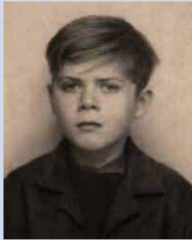
Giuseppe Sarto enfant...

L E PAPE SAINT PIE X avait pour nom Giuseppe Sarto. Joseph est né d'un positif et appariteur et d'une couturière, le 2 juin 1835 à Riese en Vénétie, dans le diocèse de Trévise encore sous protectorat de l'Empire austro-hongrois.