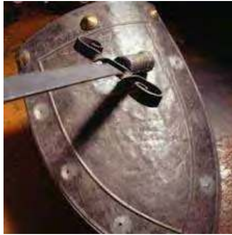
Le bouclier de la foi

fumantes lançaient des balles de plomb, des flèches et toutes sortes d'autres projectiles. Mais dès qu'ils arrivaient sur le