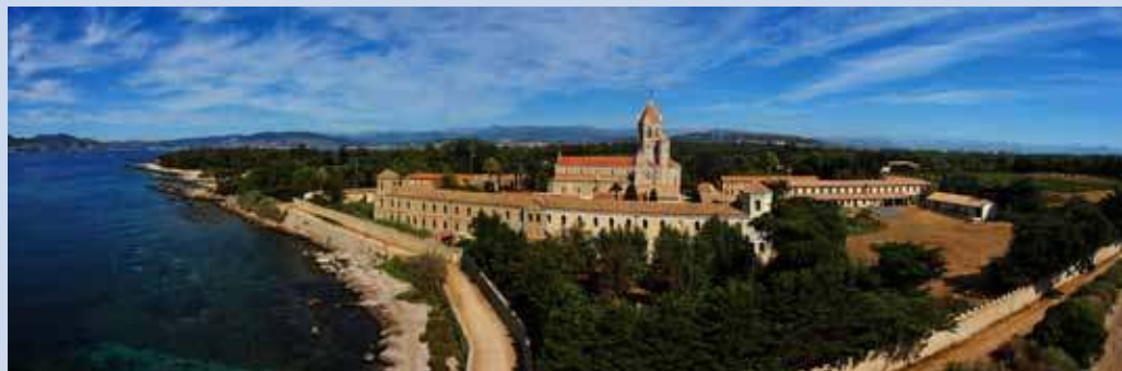
Abbaye de Lérins

Saint Antoine, quant à lui, gagna, vers 482, la cité de Constance auprès de son oncle. De là, il traversa l'Helvétie pour gagner la Valteline, région italienne à l'est du lac de Côme, où se