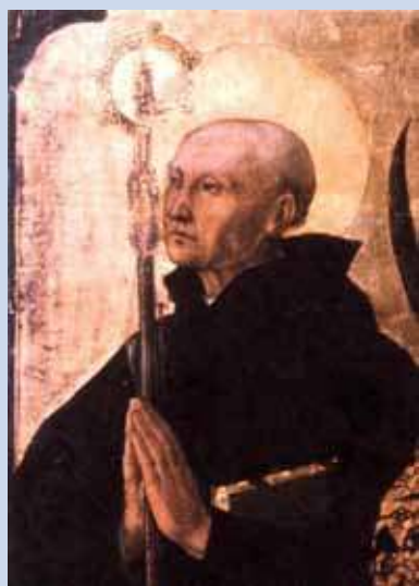
Saint Séverin du Norique (410-482)