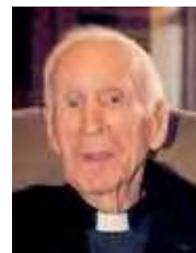
Henri de Lubac