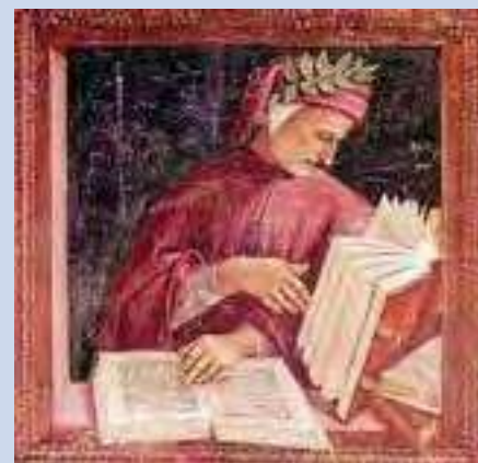
Saint Magnus Félix Ennode (474-521)

Saint Magnus Félix Ennode, évêque de Pavie de 514 jusqu'à son décès le