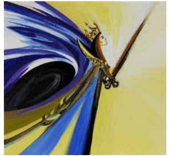
Saint Michel (M. del C. Villavecques de Bondy, 2006)

Il est à noter que la société actuelle, et les hommes en général, suivent le même péché : l'orgueil (vouloir prendre la place de Dieu, se faire Dieu). Le thème de notre