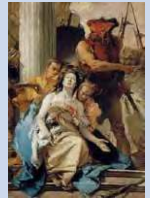
Le Martyre de sainte Agathe (Tiepolo, v. 1750)

Quant à l'empereur Dèce, n'ayant régné que deux ans, il meurt embourbé en campagne à la fin de l'an 251.