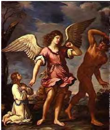
L'Ange gardien protégeant un enfant du démon (Le Guerchin, xvifs.)

Notre-Seigneur Jésus-Christ lui-même nous révèle l'existence de notre ange gardien : « Gardez-vous de mépriser un seul de ces petits, car je vous dis, leurs anges dans les cieux voient sans cesse la face