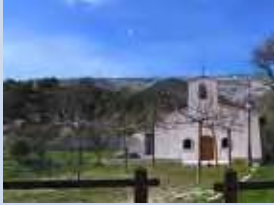
Chapelle Sainte-Agathe, Riboux

Sainte Agathe est vénérée dans le diocèse de Fréjus-Toulon où les églises de Riboux 1 et d'Esparron 2 lui sont dédiées, des chapelles à Besse-sur-Issole, et au Cap Brun, tout près de notre prieuré de Toulon, portent son nom, et des tableaux la représentent, comme dans l'église de Mons.