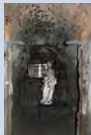
Le cachot de sainte Agathe, à Catane

Le lendemain, Agathe affiche la même constance devant Quintien qui la fait étendre sur le chevalet : elle ne cède en rien aux tortures de lames incandescentes. Dépit, Quintien lui fait couper les seins. De quoi Agathe le blâme : « Cruel tyran, ne devrais-tu pas rougir de mutiler chez une femme ce que tu as sucé chez ta mère ? » Elle est réincarcérée, sans aucun soin ni aucune nourriture. La nuit suivante, un vieillard lui apparaît dans une lumière éclatante : « Je suis l'Apôtre du Christ, n'aie aucun doute à mon sujet, ma fille. C'est lui-