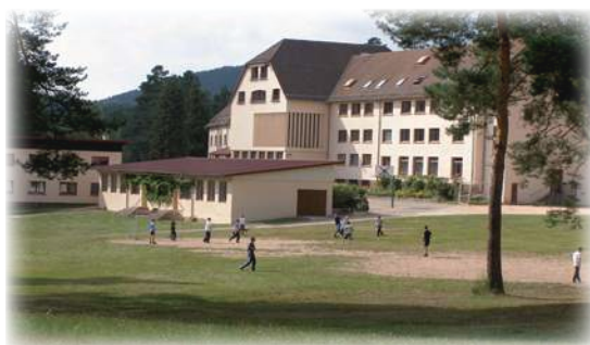
Y avez-vous pensé ? L'École pour vos garçons !

Quoi qu'il en soit de nos moyens trop limités, nous faisons et ferons tout ce que nous pourrions pour être de vrais pasteurs, pour le bien de vos âmes.