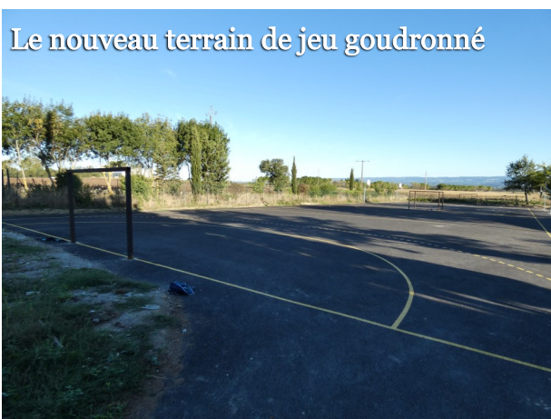
Le nouveau terrain de jeu goudronné