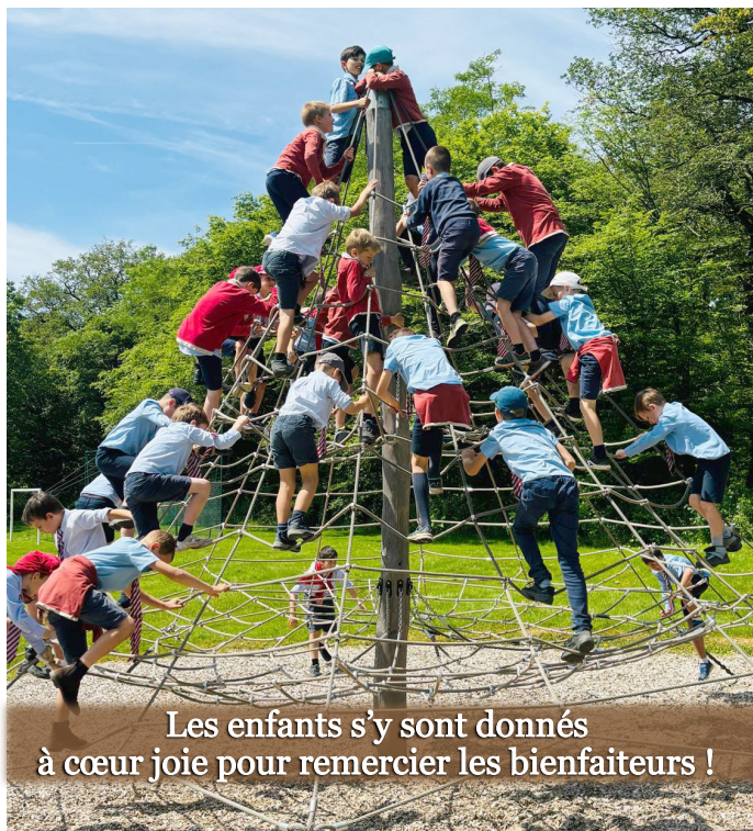
Les enfants s'y sont donnés à cœur joie pour remercier les bienfaiteurs !

Nous avons ainsi fait le maximum pour permettre la bonne intervention des entreprises dès que la consultation sera terminée. Côté permis de construire, des retards de l'administration nous obligent à reporter de plusieurs mois le lancement officiel du chantier. Dieu aidant, les premières classes pourraient être livrées pour la rentrée 2025.