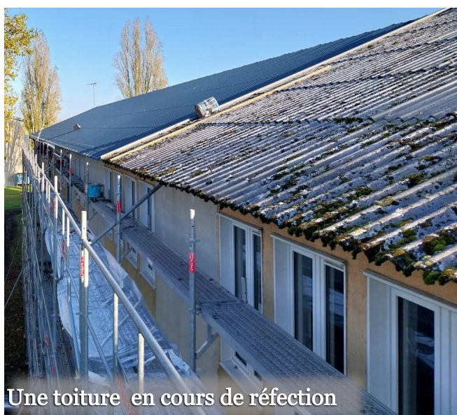
Une toiture en cours de réfection

Les 229 élèves (186 secondaires et 43 primaires) observent également depuis le début d'année les travaux en extérieur des entreprises en charge de la réfection de sept toitures, impactées par la grêle du 22 mai 2022. A l'issue, les trois bâtiments d'internat seront revêtus de