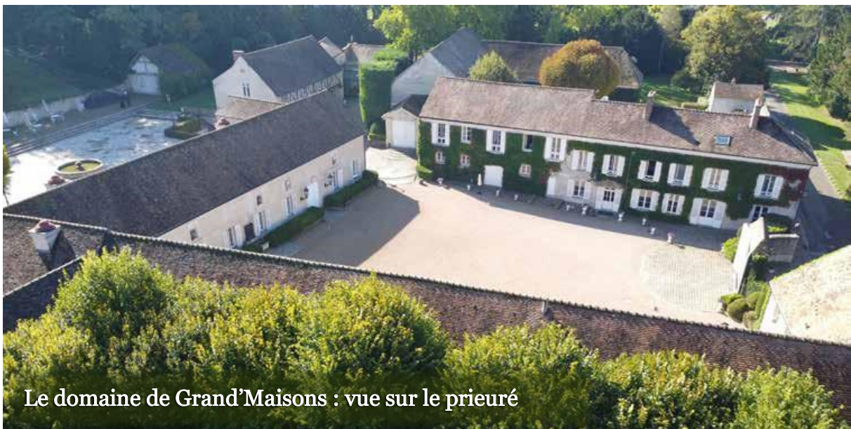
Le domaine de Grand'Maisons : vue sur le prieuré

Le domaine de Grand'Maisons à Villepreux est fort apprécié par les fidèles et la communauté religieuse du prieuré Saint-Vincent-de-Paul, mais attend avec impatience l'autorisation d'entamer la première tranche des travaux dans le cadre du déménagement de l'école Saint-Bernard. Merci aux bienfaiteurs d'hier et de demain : plus que jamais, nous avons besoin de vous !