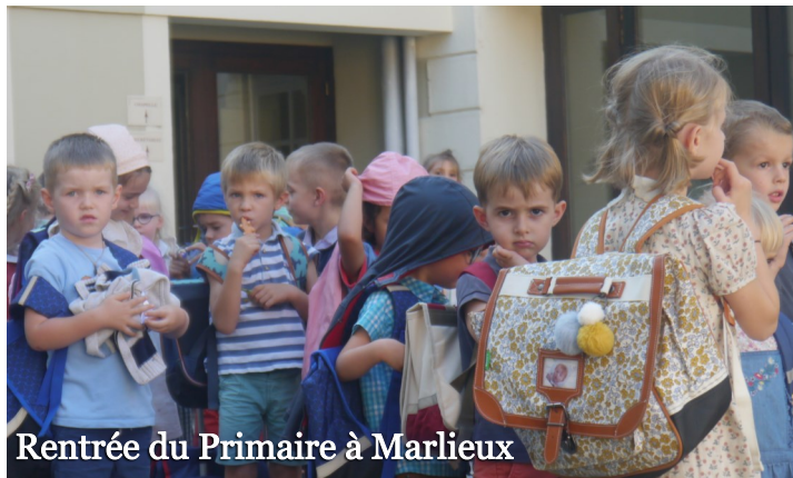
Rentrée du Primaire à Marlieux