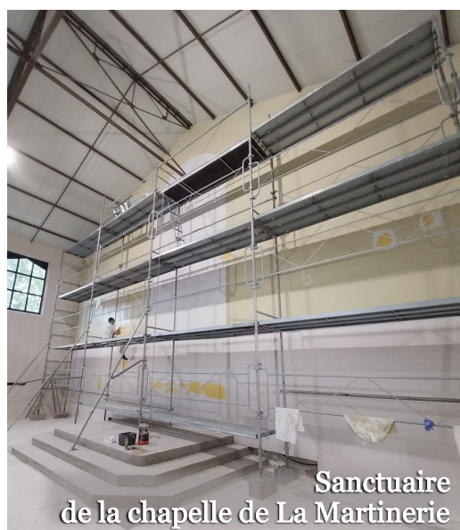
Sanctuaire de la chapelle de La Martinerie