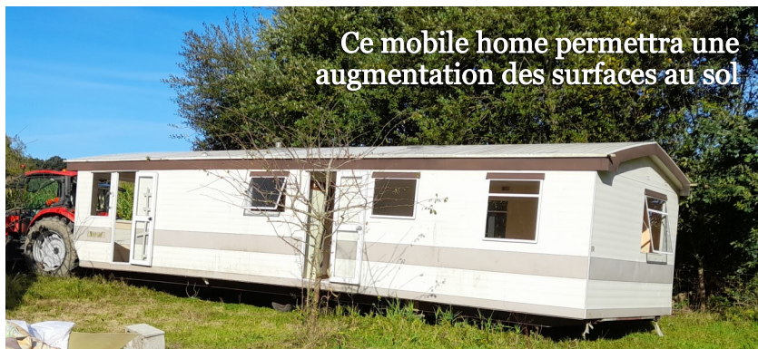
Ce mobile home permettra une augmentation des surfaces au sol

Un bienfaiteur nous a fait don en fin d'année scolaire d'ouvrages de qualité à destination de notre CDI dont nous préparons le transfert dans un mobile home en cours d'aménagement.