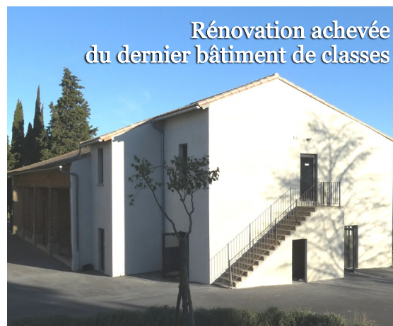
Rénovation achevée du dernier bâtiment de classes