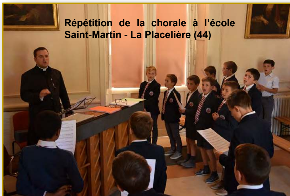
Répétition de la chorale à l'école Saint-Martin - La Placelière (44)

Le pape l'affirme à la fin de son encyclique : « La fin propre et immédiate de l'éducation chrétienne est de concourir à l'action de la