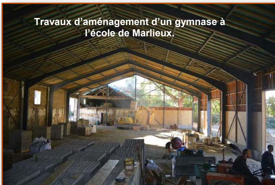
Travaux d'aménagement d'un gymnase à l'école de Marlieux.

L'école de Marlieux située près de Lyon poursuit son extension. L'aménagement d'une grange en gymnase permettra aux élèves