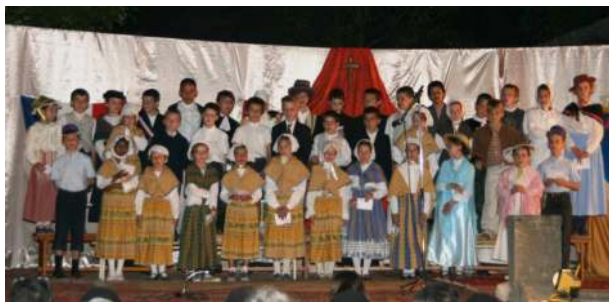
Le tableau final du spectacle de fin d'année

au tribunal. Avec joie, les enfants offrent leur représentation aux prêtres du Prieuré, à leurs parents et à ceux qui, souvent dans le secret, font vivre leur école. Après les derniers applaudissements, c'est le grand départ pour des vacances bien méritées !