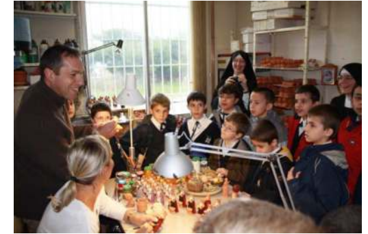
Admirer le savoir-faire des santonniers...

Semaine-Sainte : Un montage avec photos des lieux saints et une petite conférence de M. le Directeur aident les enfants à bien vivre cette grande semaine. Le Jeudi-Saint, les CE2 et CM chantent la Messe Vespérale à l'église Saint-Pie X. Le Vendredi Saint, tous s'appliquent à suivre la cérémonie, en particulier le chant de la Passion, en latin, s'il vous plaît !