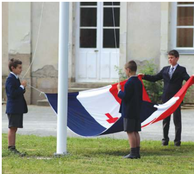
La levée des couleurs le lundi matin