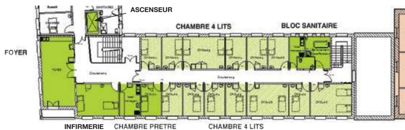
1 er étage