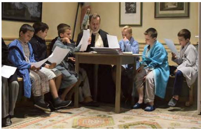
La veillée nous rassemble chaque soir au foyer, parfois avec des feuilles de chants.

Quatre ans bientôt ont passé depuis l'ouverture de l'école Saint-Martin, et il faut se rendre à l'évidence que nos locaux sont désormais trop petits : nous recevons désormais 137 élèves dans des salles de classe qui sont toutes pleines, et aucune salle n'est inoccupée.