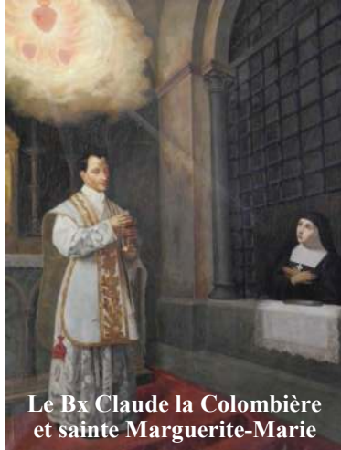
Le Bx Claude la Colombière et sainte Marguerite-Marie

Mardi 26 mars : C'est toujours émouvant de se trouver auprès d'un mourant qui essaie de s'unir, malgré son infirmité et de grandes souffrances, aux prières récitées à son chevet. Notre cher bienfaiteur – un de la première heure – rendra son âme au bon Dieu cinq jours plus tard. Plusieurs autres bienfaiteurs ont quitté ce monde ces derniers mois. Que le bon Dieu récompense au centuple leur bonté envers le Noviciat.