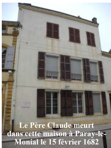
Le Père Claude meurt dans cette maison à Paray-le-Monial le 15 février 1682

mes maux, vous vous en chargez, vous savez le secret de me les tourner en bien, vous m'écoutez avec bonté, lorsque je vous raconte mes afflictions, et vous ne manquez jamais de les adoucir. Je vous trouve toujours et en tout lieu ; vous ne vous éloignez jamais ; et si je suis obligé de changer de demeure, je ne laisse pas de vous trouver où je vais. Vous ne vous ennuyez jamais de m'entendre ; vous ne vous laissez jamais de me faire du bien. Je suis assuré d'être aimé, si je vous aime. Vous n'avez que faire de mes biens, et vous ne vous appauvrissez point en me communiquant les vôtres. Quelque misérable que je sois, un plus noble, un plus bel esprit, un plus saint même ne m'enlèvera point votre amitié ; et la mort qui nous arrache à tous les autres amis, me doit réunir avec vous. Toutes les disgrâces de l'âge ou de la fortune ne peuvent vous détacher de moi ; au contraire, je ne jouirai jamais de vous plus pleinement, vous ne serez jamais plus proche que lorsque tout me sera le plus contraire. Vous souffrez mes défauts avec une patience admirable ; mes infidélités mêmes, mes ingratitude ne vous blessent point tellement que vous ne soyez toujours prêt à revenir, si je veux.