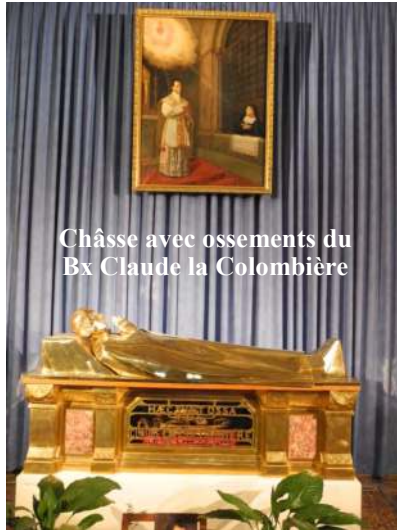
Châsse avec ossements du Bx Claude la Colombière

Un homme qui ne craint pas Dieu ne saurait être bon ami ; il faut choisir