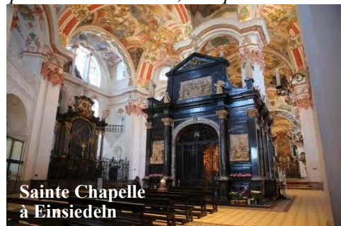
Sainte Chapelle à Einsiedeln

monta à Einsiedeln pour consacrer le nouveau sanctuaire, une vision céleste l'avertit de ne pas consacrer la chapelle de saint Meinrad, car elle l'avait été par Dieu lui-même en présence des saints anges. » (Échos de St-Maurice, 1934, tome 33)