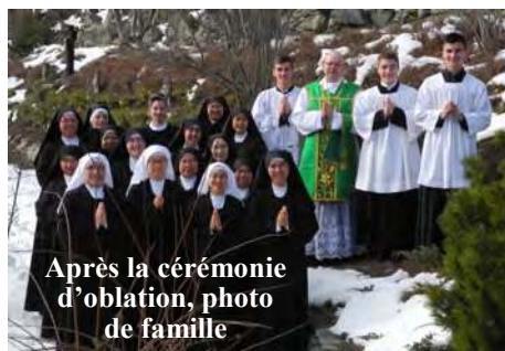
Après la cérémonie d'oblation, photo de famille

Samedi 2 mars : Einsiedeln, le lieu de pèlerinage marial le plus important en Suisse, est le but de notre excursion. Dans la sainte Chapelle à l'entrée de l'église abbatiale, les sœurs se recueillent devant la statue de Notre-Dame des Ermites et confient à la Madone noire de nombreuses intentions de prières. A l'occasion de cette visite est évoquée la consécration miraculeuse du sanctuaire en l'an 948. « Une tradition millénaire rapporte que quand saint Conrad, évêque de Constance,