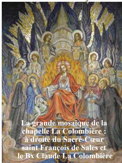
La grande mosaïque de la chapelle La Colombière : à droite du Sacré-Cœur saint François de Sales et le Bx Claude La Colombière