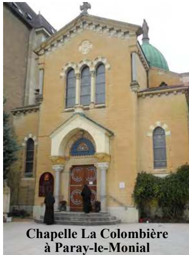
Chapelle La Colombière à Paray-le-Monial

Mais, pour juger de l'effet qu'eurent ces paroles, il ne faut