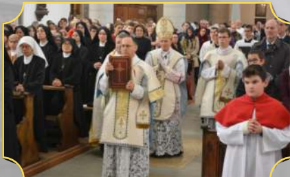
5/10/2019 : Procession du sanctuaire de Notre-Dame de Bourguillon à Fribourg où S. E. Mgr Lefebvre réunissait en 1969 ses premiers séminaristes, suivie de la Messe pontificale dans l'église Saint-Maurice