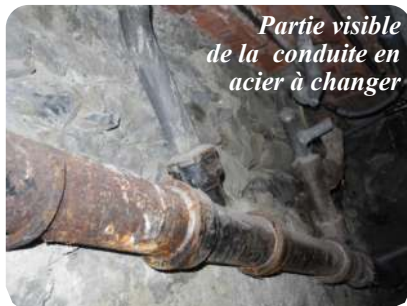
Partie visible de la conduite en acier à changer

En effet, ce tuyau en acier, partiellement enterré, est en mauvais état. Le contrôle effectué avec une caméra par une entreprise a montré plusieurs fissures dans la partie extérieure du tuyau. Nous pouvons constater dans la chaufferie un décollement du carrelage et le gonflement d'un mur, là où la canalisation traverse le bâtiment pour rejoindre la conduite communale.