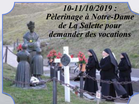
10-11/10/2019 : Pèlerinage à Notre-Dame de La Salette pour demander des vocations