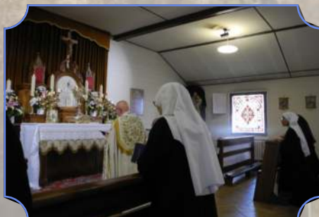
Mars 2020 : Heures d'adoration supplémentaires pendant le premier confinement pour soutenir les fidèles privés de la sainte messe