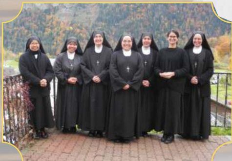
Octobre 2020 : Photo de communauté avec notre nouvelle postulante brésilienne