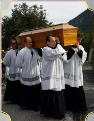
24/9/2020 : Translation de la dépouille mortelle de S. E. Mgr Marcel Lefebvre dans la crypte de l'église du Cœur Immaculé de Marie à Écône