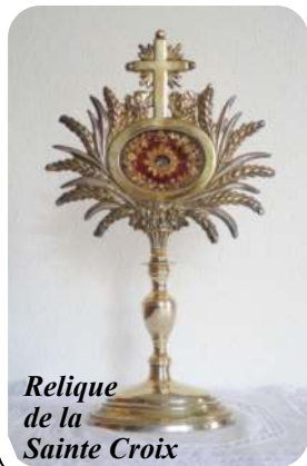
Relique de la Sainte Croix

Confiant ces travaux à votre générosité, nous vous exprimons dès maintenant notre profonde reconnaissance pour votre aide si fidèle et tant appréciée par notre communauté ! Trois saintes messes seront offertes à toutes vos intentions.