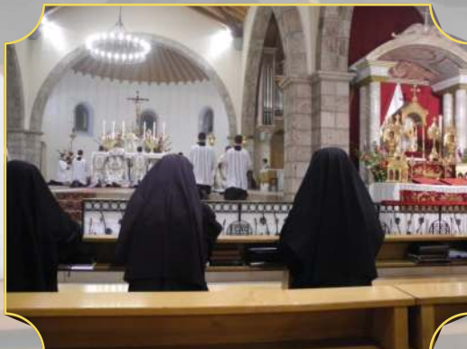
1/11/2020 : Vêpres pontificales au séminaire d'Écône le jour du 50 e anniversaire de la fondation de la Fraternité Sacerdotale Saint-Pie X