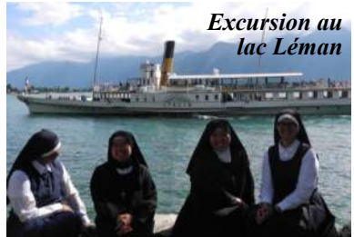
Excursion au lac Léman

Vivre d'Amour, c'est naviguer sans cesse Semant la paix, la joie dans tous les cœurs Pilote Aimé, la Charité me presse Car je te vois dans les âmes mes sœurs La Charité voilà ma seule étoile A sa clarté je vogue sans détour J'ai ma devise écrite sur ma voile : « Vivre d'Amour. »