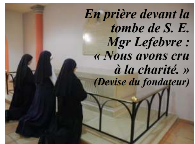
En prière devant la tombe de S. E. Mgr Lefebvre : « Nous avons cru à la charité. » (Devise du fondateur)