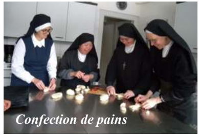
Confection de pains

Vivre d'Amour, c'est donner sans mesure Sans réclamer de salaire ici-bas Ah ! sans compter je donne étant bien sûre Que lorsqu'on aime, on ne calcule pas !... Au Cœur divin, débordant de tendresse J'ai tout donné... légèrement je cours Je n'ai plus rien que ma seule richesse Vivre d'Amour.