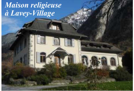
Maison religieuse à Lavey-Village

Les généreux dons reçus en vue des travaux prévus à Salvan avant le nouveau projet seront affectés à l'aménagement de notre nouvelle maison, sauf avis contraire de votre part. Nous vous remercions profondément du soutien que vous nous avez apporté jusqu'à présent et que vous continuerez à nous apporter pour notre installation à Lavey. Grâce à votre générosité, le Noviciat de Salvan a pu accueillir des vocations du monde entier et aboutir à la création d'un deuxième Noviciat aux Philippines. Daigne Notre Seigneur Jésus-Christ répandre sur vous les richesses d'amour et de grâces enfermées dans son divin Cœur en retour de votre charité à notre égard.