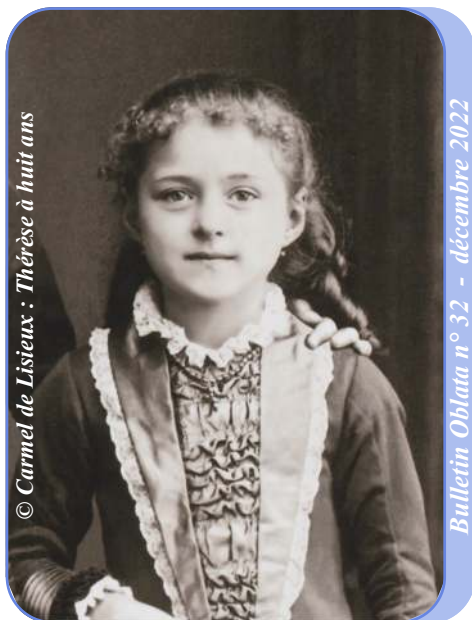
Thérèse à huit ans