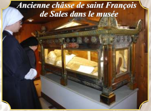
Ancienne châsse de saint François de Sales dans le musée

Mercredi 10 août : Pendant leur camp à Salvan, 23 louveteaux et leurs chefs se dévouent généreusement dans le jardin du Noviciat et aident les sœurs à vider leur grenier. En effet, des fourmis se sont installées sous la toiture, d'où la nécessité d'un traitement.