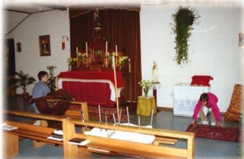
« Dieu premier servi ! » Chapelle de l'Institut Saint-Marcel

Salvan Institut Saint-Marcel 1987 - 1996