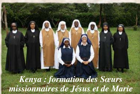
Kenya : formation des Sœurs missionnaires de Jésus et de Marie