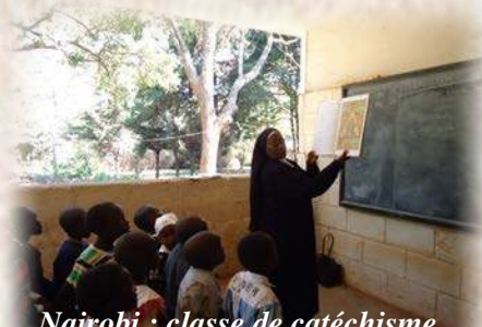
Nairobi : classe de catéchisme