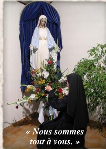
« Nous sommes tout à vous. »