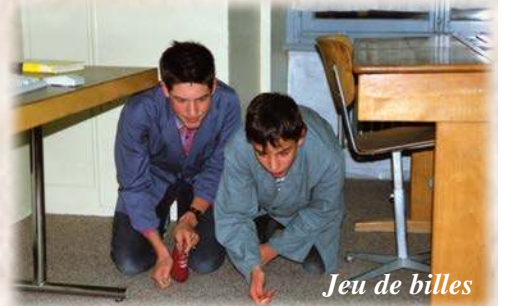
Jeu de billes

La seule chose nécessaire est d'aimer Dieu.