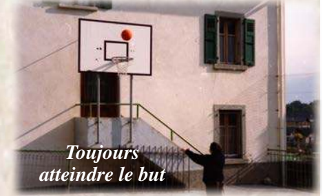
Toujours atteindre le but

Ma plus entière confiance, elle est en Dieu.