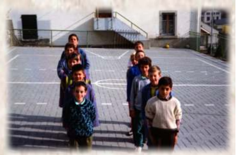
En rang dans la cour