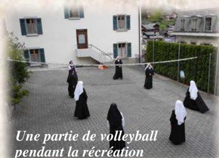
Une partie de volleyball pendant la récréation