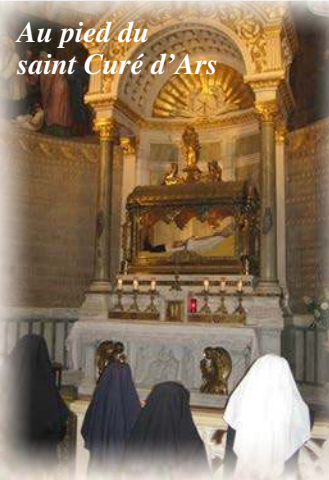
Au pied du saint Curé d'Ars