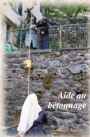
Aide au bétonnage