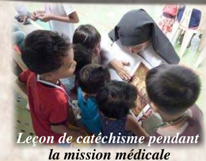
Leçon de catéchisme pendant la mission médicale