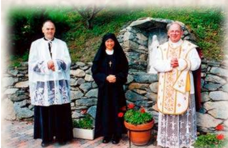
Après l'oblation perpétuelle

« Recevez, très chère fille, ce rosaire béni que vous porterez perpétuellement en signe de votre amour envers la bienheureuse Vierge Marie et de son spécial patronage sur vous. » (Rituel de la prise d'habit des sœurs oblates)