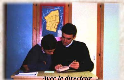
Avec le directeur