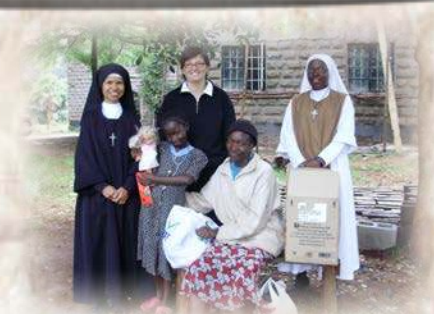
Sœur oblate avec postulante et novice des Sœurs missionnaires