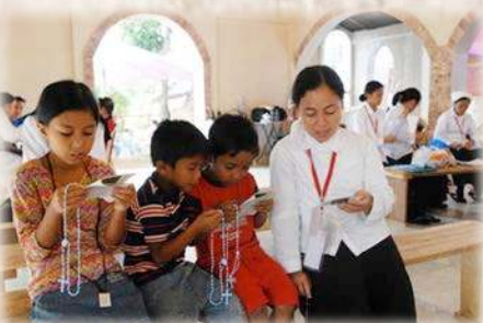
Béthanienne (actuellement novice à Salvan) enseignant le chapelet