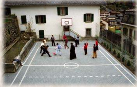
Un petit match de foot pendant la récréation

Ma plus entière confiance, elle est en Dieu.