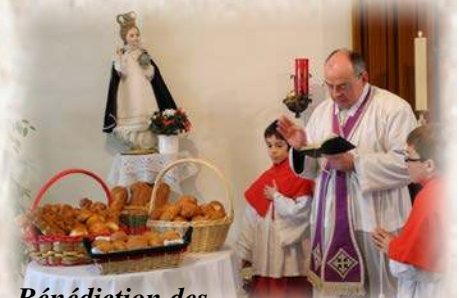
Bénédiction des pains en la fête de sainte Agathe