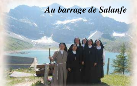
Au barrage de Salanfe