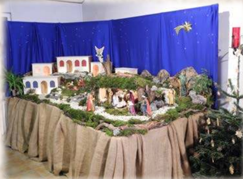
« Venite adoremus ! »