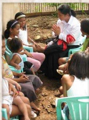
Béthanienne (entrée à Salvan en mars 2012) enseignant à prier