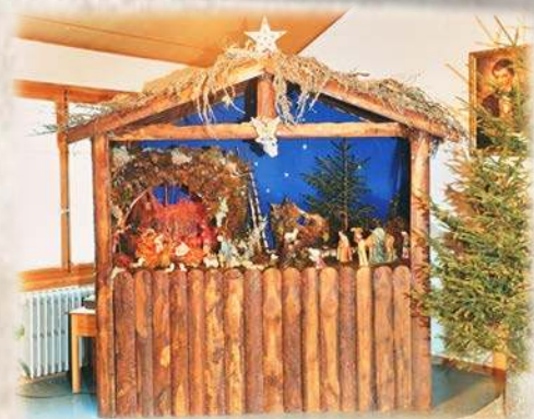
« Puer natus est nobis. »