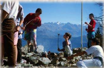
Grillade en altitude

La seule chose nécessaire est d'aimer Dieu.