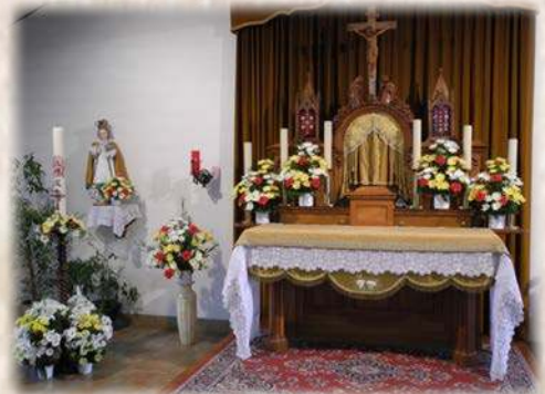
Chapelle du Noviciat : Pâques 2012