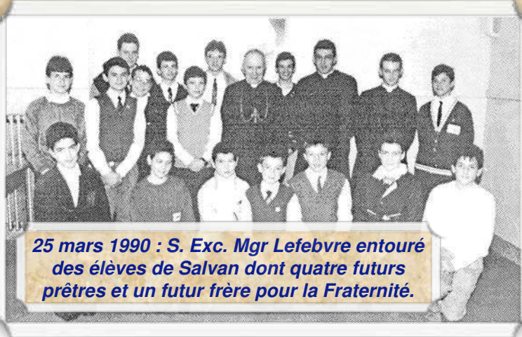
25 mars 1990 : S. Exc. Mgr Lefebvre entouré des élèves de Salvan dont quatre futurs prêtres et un futur frère pour la Fraternité.

Les 25 ans de la Fraternité St-Pie X à Salvan : Institut St-Marcel et Noviciat Ste-Thérèse