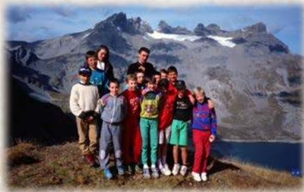
Excursion dans les alpes valaisannes