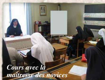
Cours avec la maîtresse des novices