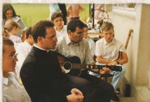
Le premier directeur entouré d'élèves