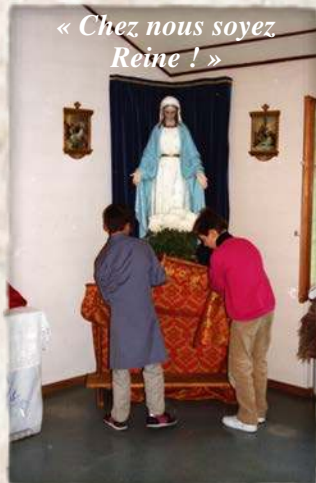
« Chez nous soyez Reine ! »