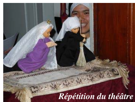
Répétition du théâtre