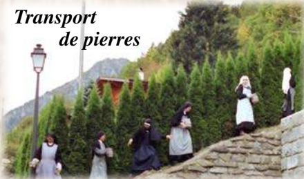
Transport de pierres

« Aimer, c'est tout donner et se donner soi-même. »