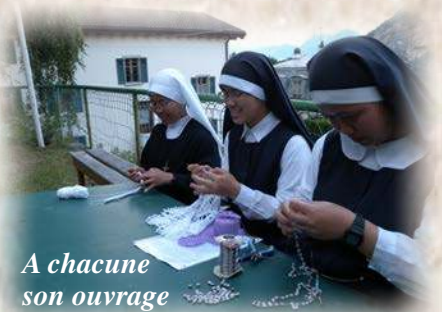
A chacune son ouvrage