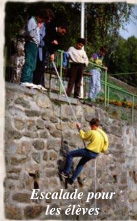
Escalade pour les élèves