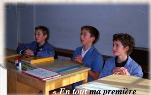
« En tout ma première pensée sera pour Dieu. »

« Je veux te faire cadeau de la formule de sainteté : 1. Joie 2. Devoir d'étude et de prière 3. Faire du bien aux autres. » (Saint Jean Bosco)