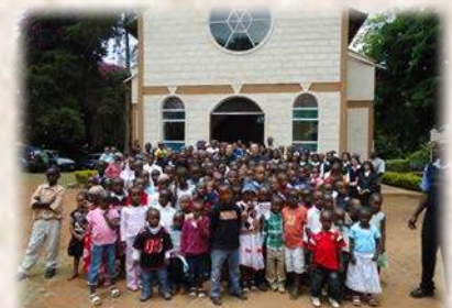
Nairobi : avec les enfants du catéchisme

(Sainte Thérèse de l'Enfant-Jésus, « Histoire d'une âme »)