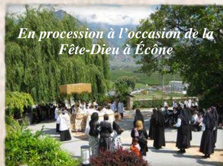
En procession à l'occasion de la Fête-Dieu à Écône