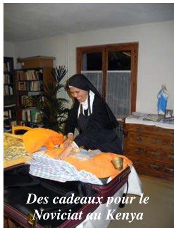
Des cadeaux pour le Noviciat au Kenya