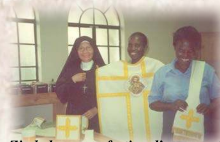
Zimbabwe : confection d'ornements avec des membres de la Légion de Marie