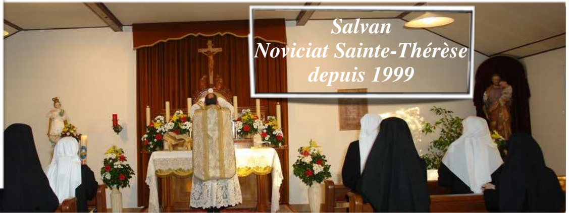
Salvan Noviciat Sainte-Thérèse depuis 1999