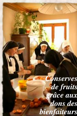
Conserves de fruits grâce aux dons des bienfaiteurs