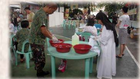
Magnifique entraide : prêtres, médecins, infirmières, militaires, sœurs oblates...