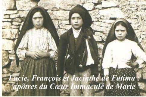
Lucie, François et Jacinthe de Fatima : apôtres du Cœur Immaculé de Marie

la sacro-sainte Vierge est la source de la vie de trois grands mondes. Car premièrement, nous avons déjà vu, qu'il est la source de la vie d'une Mère de Dieu, qui est un monde beaucoup plus rempli de choses grandes et merveilleuses qui n'est pas ce monde qui paraît à nos yeux.