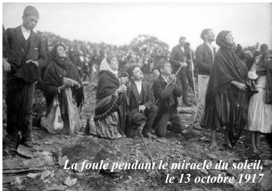
La foule pendant le miracle du soleil, le 13 octobre 1917