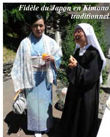
Fidèle du Japon en Kimono traditionnel