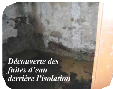
Découverte des fuites d'eau derrière l'isolation

Permettez-nous de confier la remise en état à votre bienveillance. Une neuvaine de messes sera célébrée pour tous ceux qui nous aideront à achever ces travaux. Que saint Joseph récompense au centuple votre générosité !