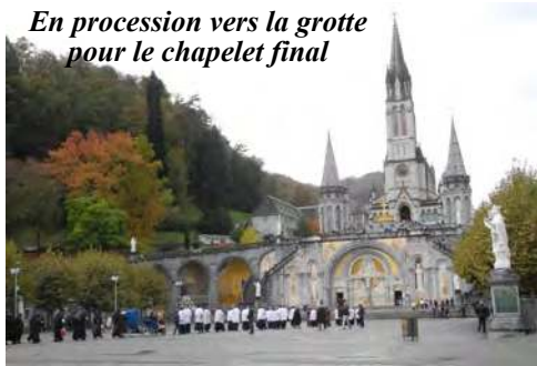
En procession vers la grotte pour le chapelet final

Lundi 15 octobre : M. l'abbé Pfluger administre l'Extrême-Onction à une voisine qui recevra le lendemain la sainte communion de ses mains. De plus, en cette fête de sainte Thérèse d'Avila, elle est revêtue du scapulaire du Mont-Carmel, gage de salut éternel si on meurt revêtu de cet habit.