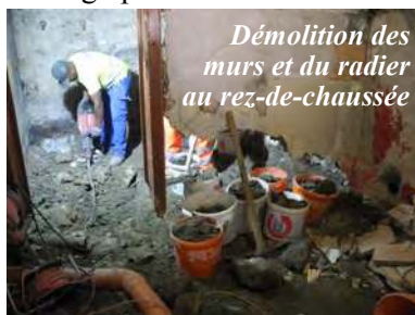
Démolition des murs et du radiateur au rez-de-chaussée