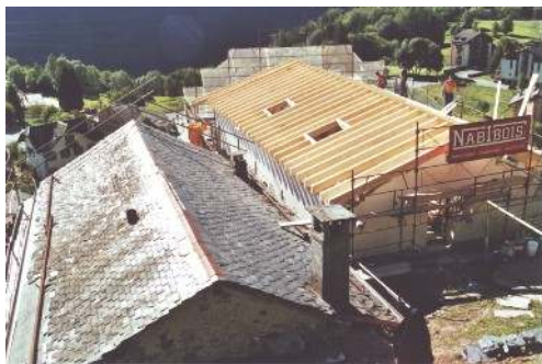
3. La nouvelle charpente. Ces travaux nous permettent la création de cinq chambres supplémentaires.

Mercredi 16 août 2006 : Commencement des travaux par les entreprises. Nos prières accompagnent les ouvriers - charpentiers, maçons, ferblantiers - qui vont réaliser les nouvelles toitures. C'est le chantier le plus important depuis l'installation du Noviciat à Salvan ... mais aussi le plus coûteux. Votre aide nous est si précieuse dans cette réfection indispensable.