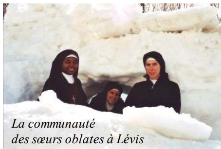
La communauté des sœurs oblates à Lévis

Dimanche 26 au mardi 28 février : A tour de rôle, nos sœurs se relayent devant le Saint-Sacrement exposé pour l'adoration des 40 heures. La réparation s'avère de plus en plus nécessaire en ce monde en dégradation.