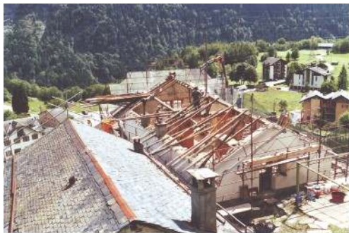
1. Sous un soleil radieux : démolition de la toiture de la maison Notre-Dame du Rosaire.