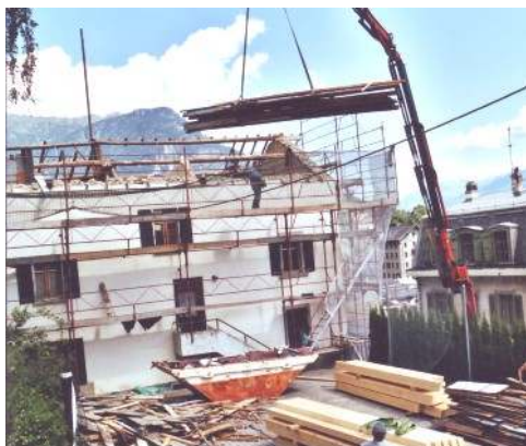
2. A l'aide d'un camion grue, l'élimination du bois pourri et le montage de la nouvelle charpente sont effectués en deux jours seulement.