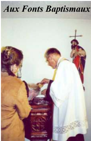
Aux Fonts Baptismaux

tale, sa maison familiale et l'ermitage de Flüeli-Ranft. Quelle délicatesse de la divine Providence de nous donner pour guide dans la maison familiale, un descendant en ligne directe du saint patron de la Suisse !