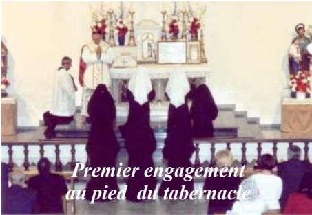
Premier engagement au pied du tabernacle