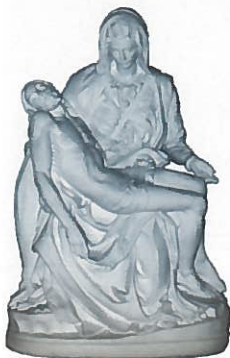
Notre-Dame de Compassion, Priez pour nous

SI VOUS DESIREZ AIDER LES SŒURS, vous pouvez envoyer votre correspondance aux :