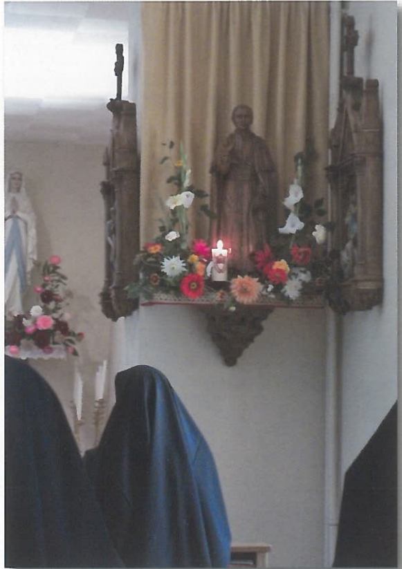
Saint Pie X à l'honneur dans la chapelle de la maison-mère

Dans l'action de grâces, nous avons célébré le quarantième anniversaire de notre fondation sous le patronage de saint Pie X et de Notre-Dame de Compassion. La Providence a voulu, à cette occasion, nous offrir un double accroissement. Trois sœurs se sont installées en Vendée au cours du mois d'août, au prieuré Notre-Dame du Rosaire des Fournils. Leur tâche principale sera l'enseignement dans la nouvelle petite école confiée à leurs soins, école qui s'ouvre le jour même de nos 40 ans, le 22 septembre. Le deuxième agrandissement