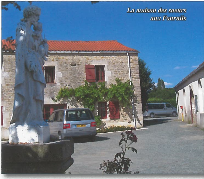
La maison des sœurs aux Fournils

Les sœurs des maisons de retraites spirituelles, après deux mois chargés,