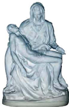
Notre-Dame de Compassion, Priez pour nous

SI VOUS DESIREZ AIDER LES SŒURS, vous pouvez envoyer votre correspondance aux :