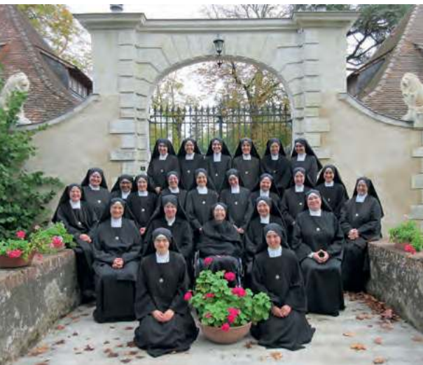
La communauté de l'abbaye Saint-Michel

Notre édifice « sera toujours indigne de la grandeur, de la sublimité, de la perfection, de la toute-puissance de Dieu. Mais cependant, que tous ceux qui y pénètrent aient au moins ce sentiment de grandeur, de noblesse, de la présence de Dieu. Qu'ils aient le désir de s'agenouiller, d'adorer Dieu, de porter sur lui un regard de foi afin de participer vraiment au mystère de Dieu.