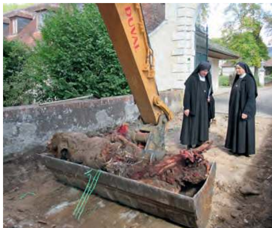
Les arbres voisins avaient poussé leurs racines jusque dans le pont...

Avec l'édifice sacré, s'élèvera également un bâtiment en T le reliant à ceux qui