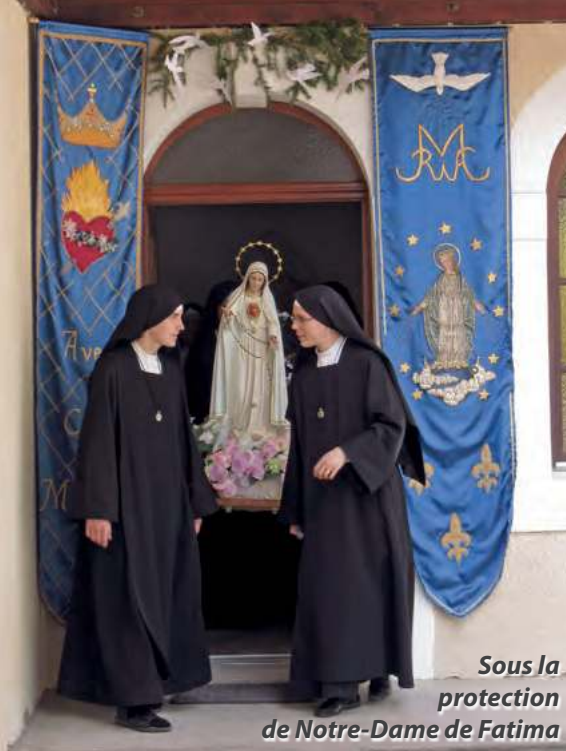
Sous la protection de Notre-Dame de Fatima

Et on pourrait faire un catéchisme complet en suivant toutes les scènes qui se développent sur les vitraux des magnifiques cathédrales comme celle de Chartres, par exemple, ou celle de Bourges, ou Notre-Dame de Paris. Que de sujets rappellent toute la vie, tous les mystères de Notre-Seigneur Jésus-Christ, de la très sainte Vierge Marie, l'ancien Testament, le nouveau Testament. Pourquoi l'Église a-t-elle inspiré ceux qui ont construit ces belles églises, pourquoi veut-elle qu'il y ait également des statues qui rappellent tous ceux qui nous ont précédés et qui sont maintenant dans leur éternité,