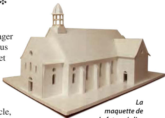
La maquette de la future église

La grande nouvelle que nous voulons partager avec vous, chers bienfaiteurs, parce que vous avez participé à nos espoirs, par vos prières et votre soutien, c'est le commencement des travaux de la future église à St-Michel-en-Brenne, que nous voulons dédier à Saint Cyran. Elle ne sera pas à l'endroit exact où s'élevait l'église abbatiale du XI e siècle, mais dans son prolongement. Ce ne sera pas, malheureusement, un aussi beau sanctuaire ! Mais le projet s'harmonisera très bien aux lieux et aux besoins de notre communauté.