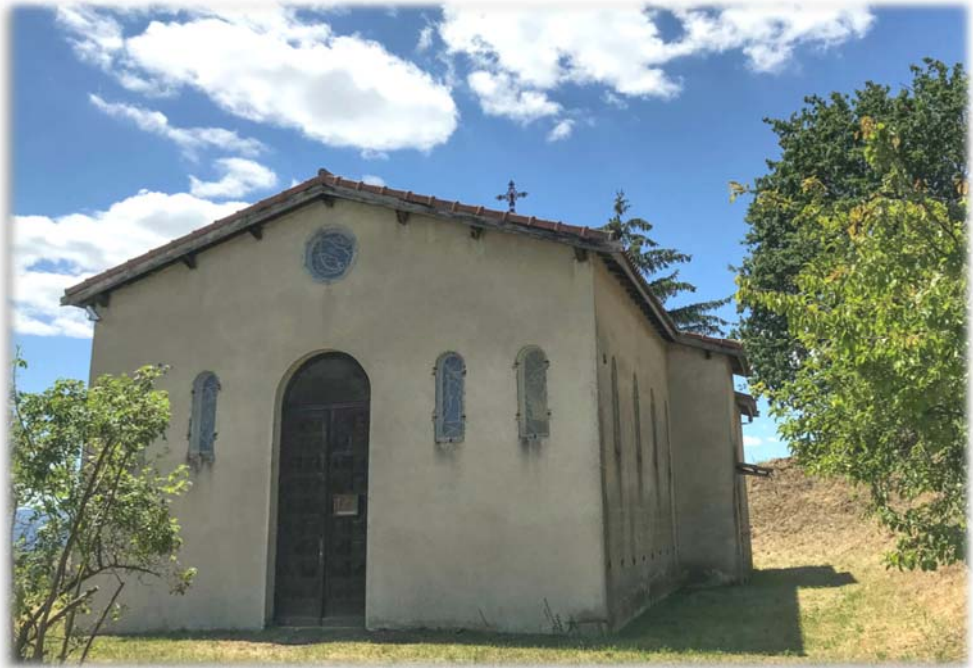
Chapelle du sanctuaire Saint-Joseph-du-Saint-Sauveur, à Chantemerle-les-Blés (26)

exigences, s'est estompé. Les chrétiens, de plus en plus, ont trouvé trop dur de se battre ; ils ont hésité à se livrer totalement à la grâce de Jésus-Christ afin qu'elle les transforme et les sauve ; ils n'ont plus voulu de son règne et des contraintes de son amour pour eux ; ils en ont eu assez de devoir toujours résister aux séductions du monde, qui conspire jour et nuit contre l'établissement de ce règne du Christ en nos âmes ; ils ont fait taire saint Paul qui leur disait : « Ne vous conformez pas au siècle présent. » (Rm 12, 2) Et finalement ils se sont découragés. Face aux agressions continues du monde, les chrétiens ont malheureusement opposé