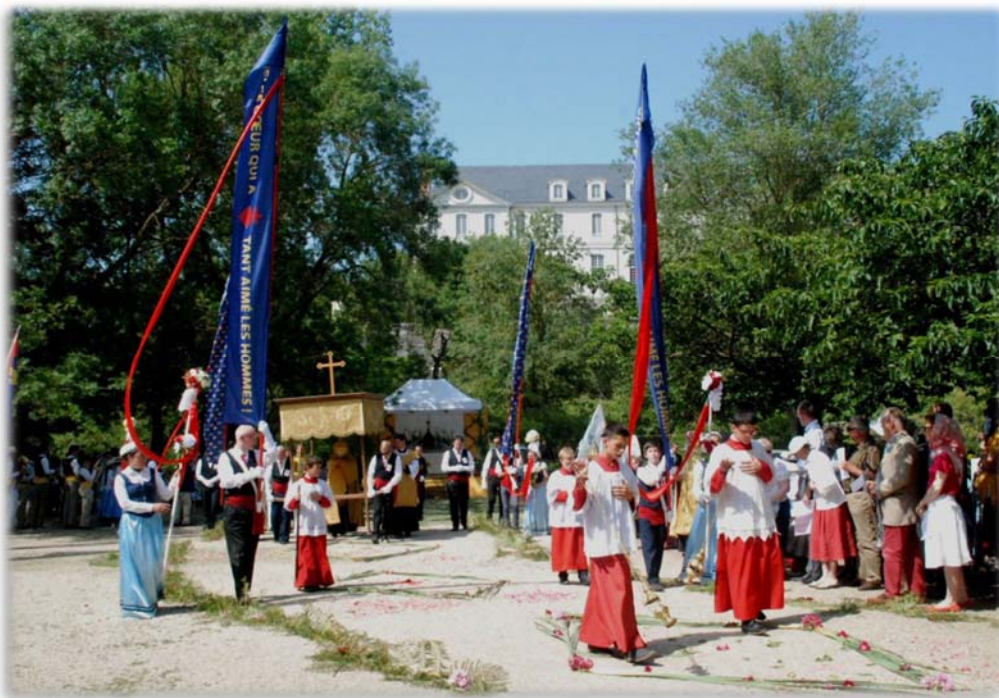
Procession du Grand Sacre, Angers

Or, ce qui rend dramatique aujourd'hui la crise dans laquelle nous nous trouvons, c'est que l'Église, depuis 60 ans, a choisi d'accueillir cet idéal moderne, et de rentrer dans cette conception d'un univers où Notre-Seigneur n'a plus qu'une place relative. Sa royauté totale n'est plus reconnue, depuis que l'Église s'est faite le chantre de la liberté religieuse : en