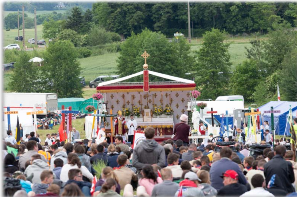
Messe au pèlerinage de Pentecôte, de Chartres à Paris

La vie spirituelle n'est pas autre chose que la vie de notre âme, pour laquelle Dieu nous a créés, et qui fera notre bonheur pour l'éternité : c'est la vie éternelle, commençant déjà ici-bas. Or, quelle définition Notre-Seigneur nous donne-t-il de cette vie ? « La vie éternelle, c'est qu'ils vous connaissent, vous, le seul vrai Dieu, et celui que vous avez envoyé, Jésus-Christ. » (Jn 17, 3) La vie spirituelle consiste donc à connaître Dieu, à connaître Jésus-Christ :