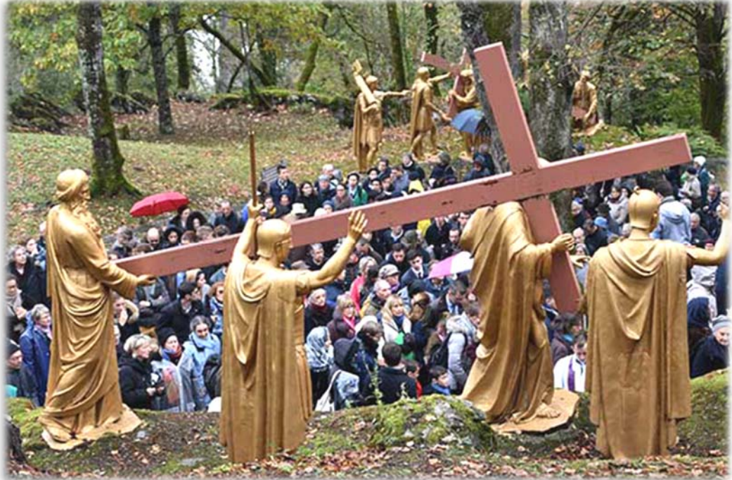
Pèlerinage du Christ-Roi à Lourdes, chemin de Croix

nos pa- roles, de tous nos actes. Et voilà pour- quoi nous menons le combat pour la messe : afin que nos âmes puissent être sancti- fiées par la grâce. Voi- là pour- quoi nous menons le