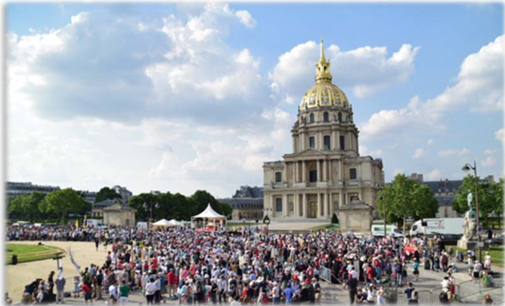
Pèlerinage de Pentecôte, de Chartres à Paris, Messe place Vauban

C'est ainsi que l'obligation de suivre à la lettre les programmes scolaires étatiques se fait de plus en plus lourde chaque année. C'est ainsi que les inspections des écoles hors contrat