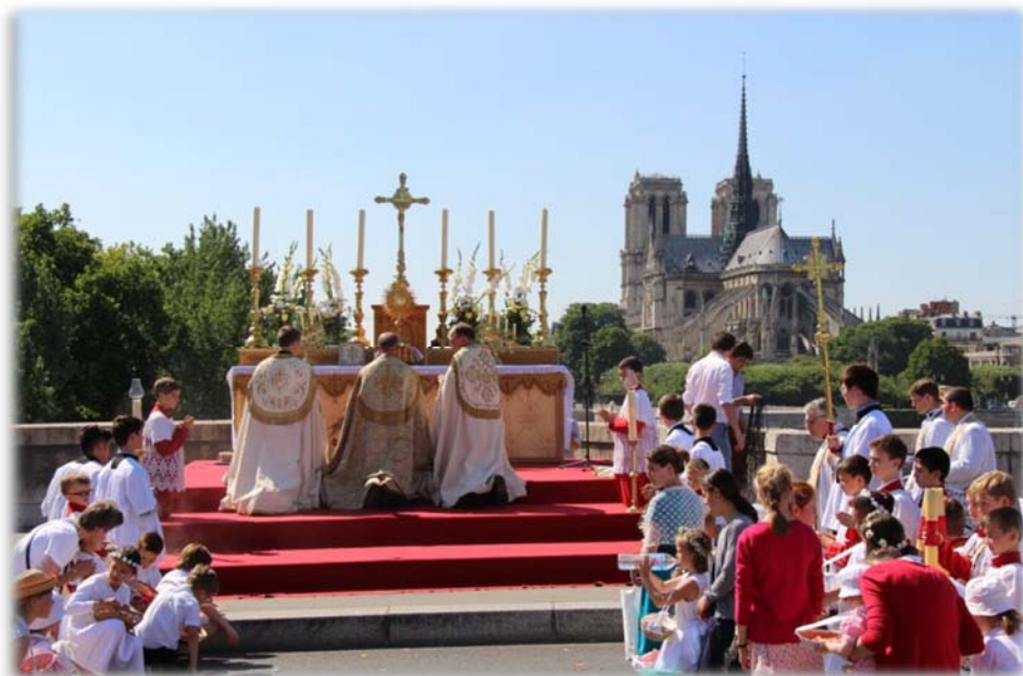
Procession de la Fête-Dieu, Paris

Chers fidèles, si nos libertés extérieures se réduisent comme peau de chagrin, il nous reste toujours le témoignage quotidien de la foi, de la fidélité à Notre Seigneur Jésus-Christ en cette époque de la « grande apostasie ». Lorsque le prophète Élie, découragé, déclara au Seigneur : « Les enfants