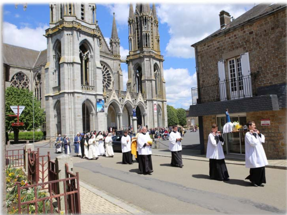
Pèlerinage à Notre-Dame de Pontmain

héroïque aux attaques de ses ennemis, pour susciter des âmes que l'épreuve rendra plus généreuses, plus offertes, plus dociles aux conquêtes de sa grâce. En un mot : plus saintes.