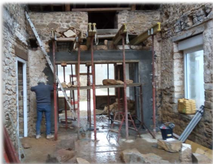
Aménagement de la chapelle, Pontmain (53)

« La notion du sacrifice est une notion profondément chrétienne et profondément catholique », rappelait