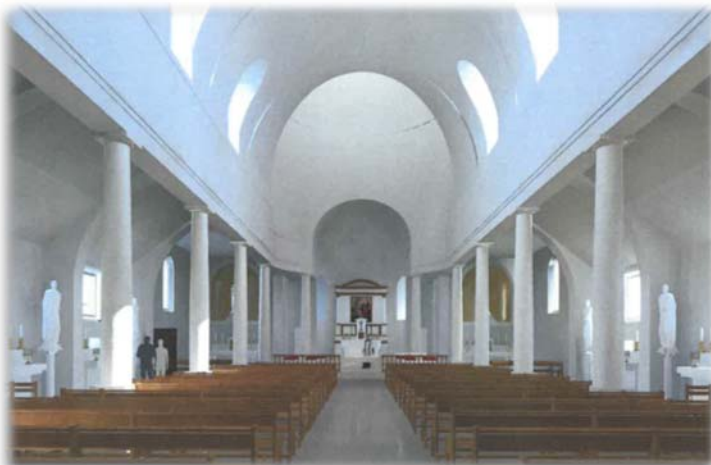
Future église à Gavrus (14)