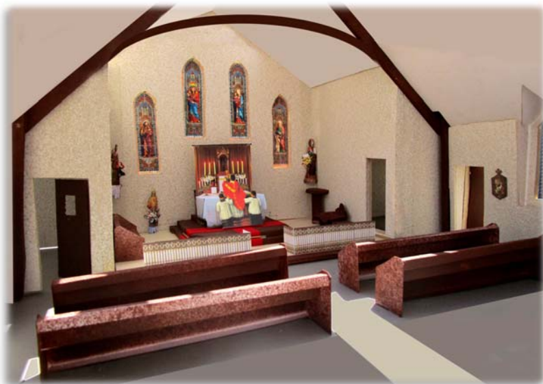
Future chapelle à Guer (56)

plus en plus, il est capital de comprendre que c'est à cette hauteur-là que la Fraternité, aujourd'hui comme hier, a le devoir de combattre, coûte que coûte.