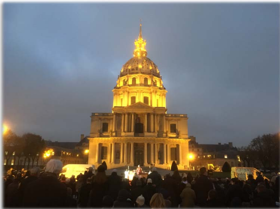
Manifestation revendicative suivie d'une messe pour contester les restrictions de culte, 1 er dimanche de l'Avent 2020, place Vauban, Paris

Passons maintenant à ce que l'on nomme le « terrorisme islamique ». Bien entendu, ces assassinats horribles, épouvantables, sont à condamner sans réserve, qui que ce soit qu'ils frappent. Et il est évidemment nécessaire