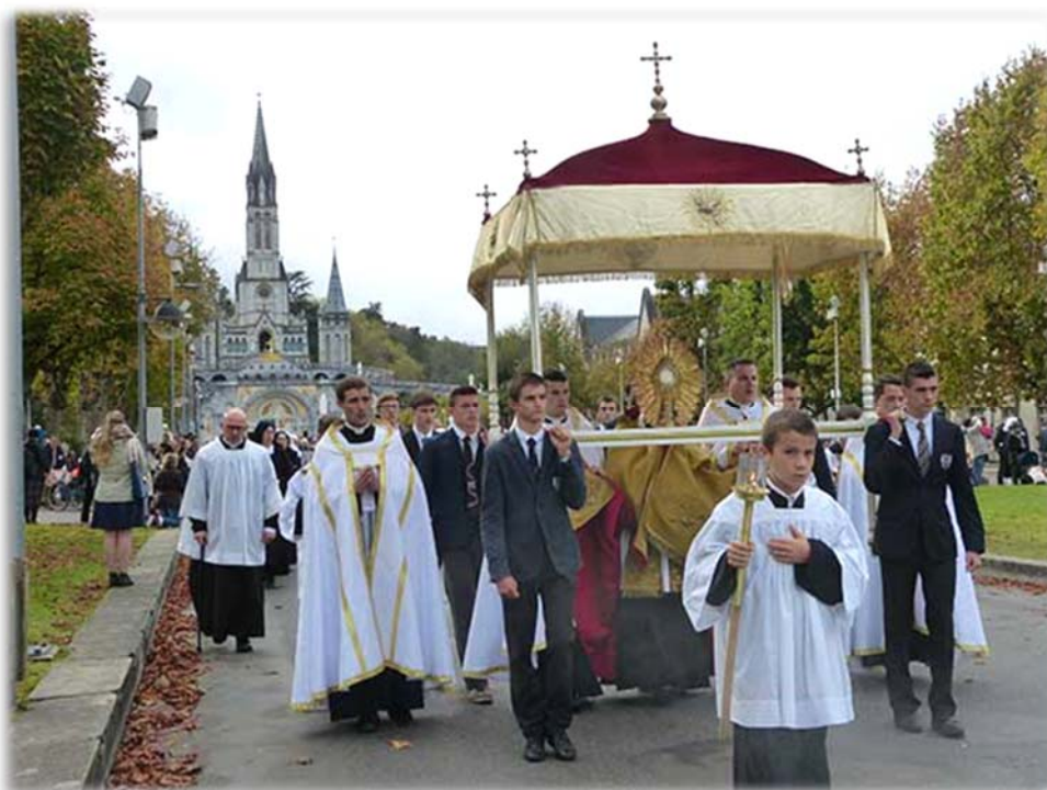
Procession du Saint-Sacrement, pèlerinage du Christ-Roi, Lourdes

Ces germes d'apostasie, par lesquels Notre-Seigneur se trouve concrètement évacué de la vie des hommes, cette absence de principe menant à la déconstruction et au chaos, inévitablement, rendent absolument impossible toute vie spirituelle unifiée, simple, centrée sur Jésus-Christ. C'est l'affranchissement