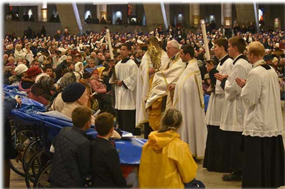
Bénédictio des malades, pèlerinage du Christ-Roi, Lourdes

D'une part, les combats de toute sorte, qui durent et dont on ne voit pas le bout, risquent de lasser : faut-il vraiment encore lutter ? D'autre part, après