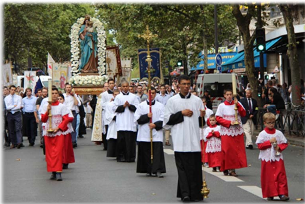
Procession de l'Assomption, Paris

Bien sûr, nous ne voyons pas encore Dieu sur la terre, tandis qu'au ciel nous le verrons face-à-face : notre foi n'est pas une connaissance absolument parfaite de Dieu... Mais la charité par laquelle nous serons éternellement unis à