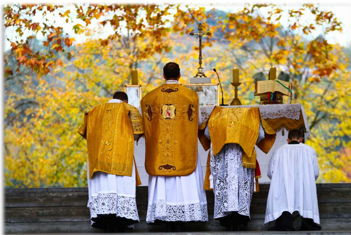
Pèlerinage du Christ-Roi et jubilé d'or de la FSSPX, Lourdes