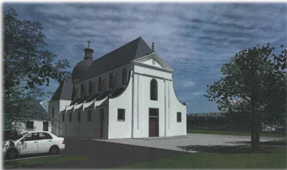
Future église à Gavrus (14)

Faute de donner à notre combat cette dimension profonde, nous risquons de mener une lutte purement abstraite : nos batailles doctrinales ne seront que des joutes cérébrales, spéculatives, désincarnées. Les idées affronteront les idées, sans que notre vie morale soit illuminée par la clarté de notre foi. Notre combat pour la messe deviendra esthétique : nous défendrons la liturgie traditionnelle pour la simple raison qu'elle est plus belle, plus priante. Cela est