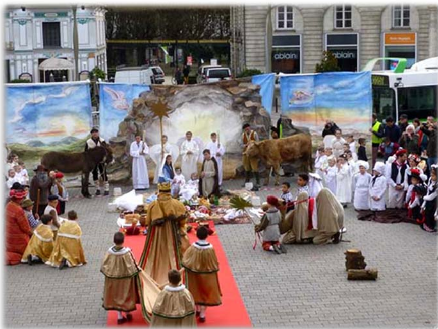
Grande crèche vivante, centre-ville de Nantes, par le prieuré de Nantes

Combien de temps durera cette crise dans l'Église ? Et surtout, pourquoi Dieu permet-il qu'elle dure encore ? Qu'attend-il de nous ? Nous avons tout