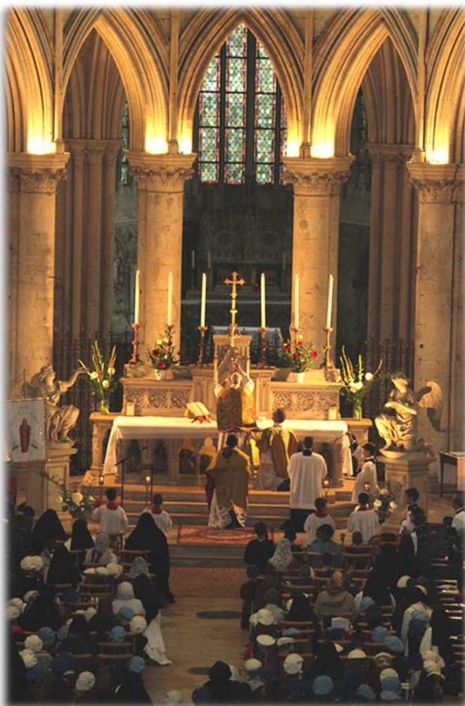
Pèlerinage à Lisieux, messe à la cathédrale

L'âme se libère alors des chaînes qui entravent sa marche vers le salut. Depuis le péché originel, l'homme déchu tend à tout rapporter à lui-même : il ne connaît plus que lui, ne s'intéresse qu'à lui, vit comme replié sur lui-même... au point d'oublier Dieu. Mais lorsque Dieu, par le baptême, inaugure en cet homme son œuvre de salut, lui donne cette connaissance de foi, et travaille par sa grâce à le rendre semblable à lui, l'homme commence à tout ramener au Christ : bientôt il ne connaît plus que lui, vit en lui, centré sur lui... au point de s'oublier lui-même. C'est l'idéal chrétien en tant que tel. Il permet de franchir tous les obstacles, jusqu'à ce que Notre-Seigneur soit véritablement la vie d'une âme toute remplie par lui. C'est la liberté vraie et définitive réalisée par celui qui est la Vérité éternelle.