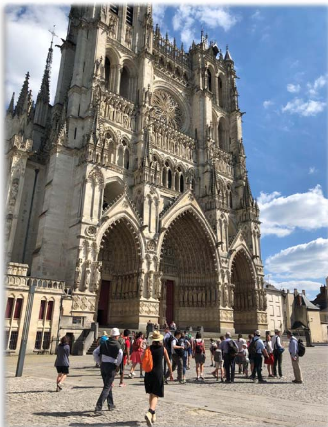
Pèlerinage local de Pentecôte d'Abbeville à Amiens

Comment l'Église a-t-elle pu arriver à cette situation catastrophique ? Comment est-il possible qu'un tel renversement se soit produit, que de telles idées aient pu être conçues dans l'Église, à l'encontre de la doctrine et de la foi de toujours ?