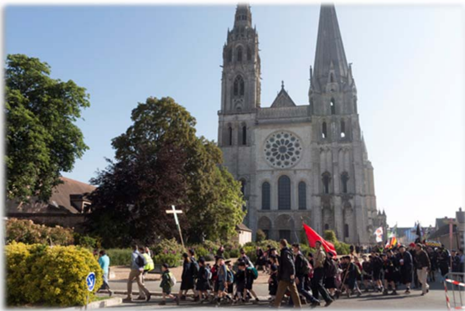
Pèlerinage de Pentecôte, de Chartres à Paris

tuaire se trouve près de Fribourg, où étudiaient en 1969-1970 les neuf premiers séminaristes qui constituèrent l'ébauche de ce qui devait, le 1 er novembre 1970, devenir la Fraternité Saint-Pie X), que Notre-Dame de Bourguillon nous garde tous dans une foi intègre jusqu'à la fin.