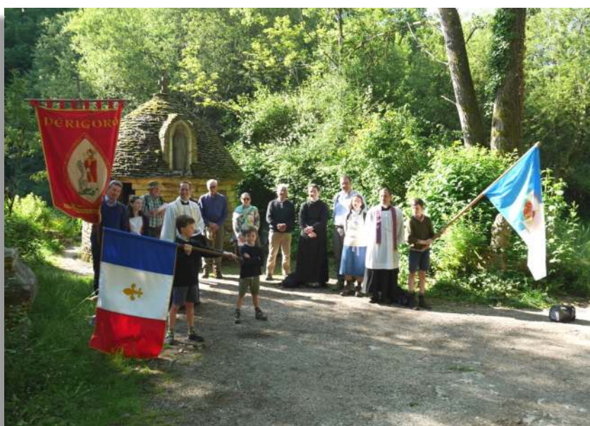
Pèlerinage local de Pentecôte, Notre-Dame-de-Fontpeyrine, Dordogne

l'intérieur même de l'Église ? La réponse est simple, et de plus en plus claire. Après cinquante ans, les éléments de réponse sont évidents pour tous les chrétiens de bonne volonté : la messe tridentine exprime et véhicule une conception de la vie chrétienne et, par conséquent, une conception de l'Église qui est absolument incompatible avec l'ecclésiologie issue du concile Vatican II. Le problème n'est pas simplement liturgique, esthétique, ou purement formel. Le problème est à la fois doctrinal, moral, spirituel, ecclésiologique et liturgique. En un mot, c'est un problème qui