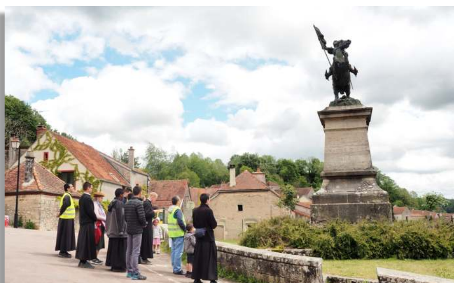
Pèlerinage local de Pentecôte, Alise-Sainte-Reine, Côte-d'Or