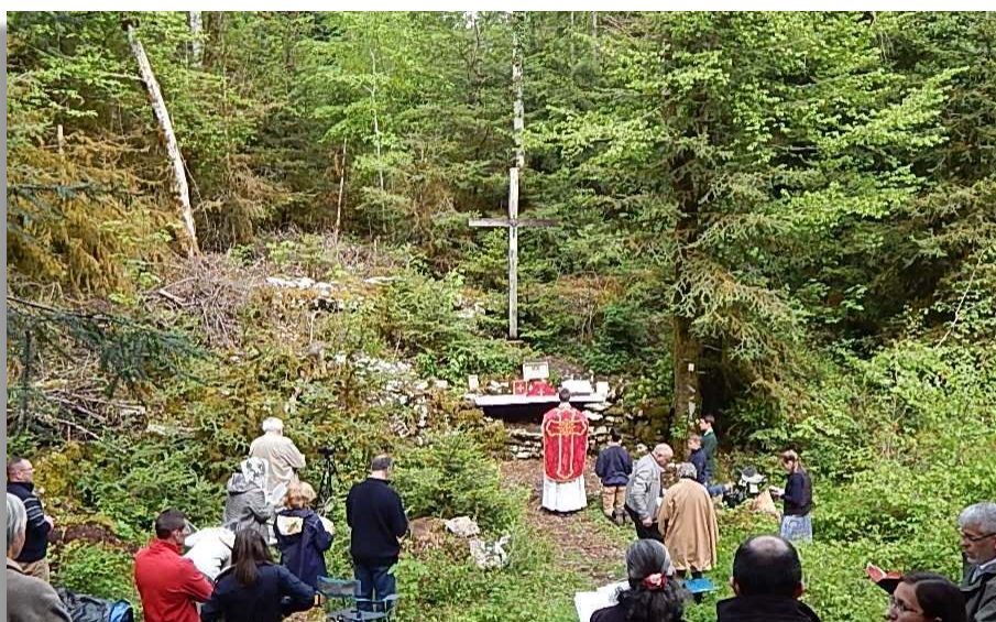
Pèlerinage local de Pentecôte, Bois de Coulans, Combe des prêtres réfractaires, Doubs

significatif, n'est pas la guerre entre deux rites : elle est bel et bien la guerre