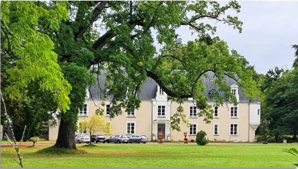
Futur prieuré de Tours à aménager

« Les prieurés sont vos paroisses ». Avec une extraordinaire lucidité, « l'évêque de fer », de son regard de sagesse, avait vu la réalité de la crise qui secouait