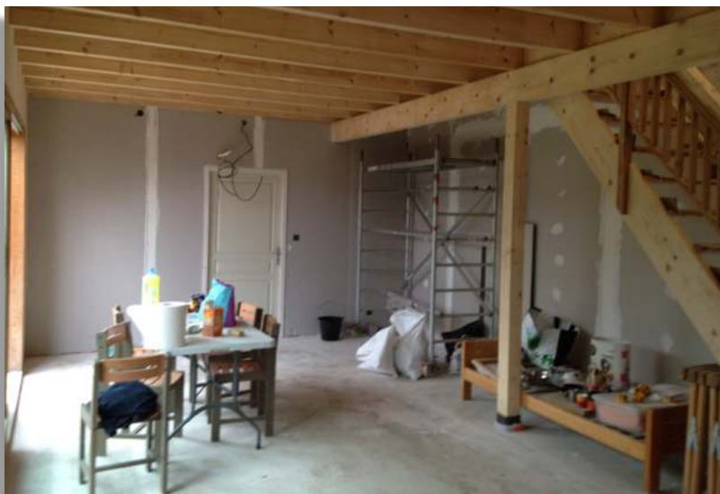
Aménagement du logement des prêtres, Saint-Baldoph

ginel, est exposée à dévier très rapidement : il est facile de le constater en notre société d'apostasie.