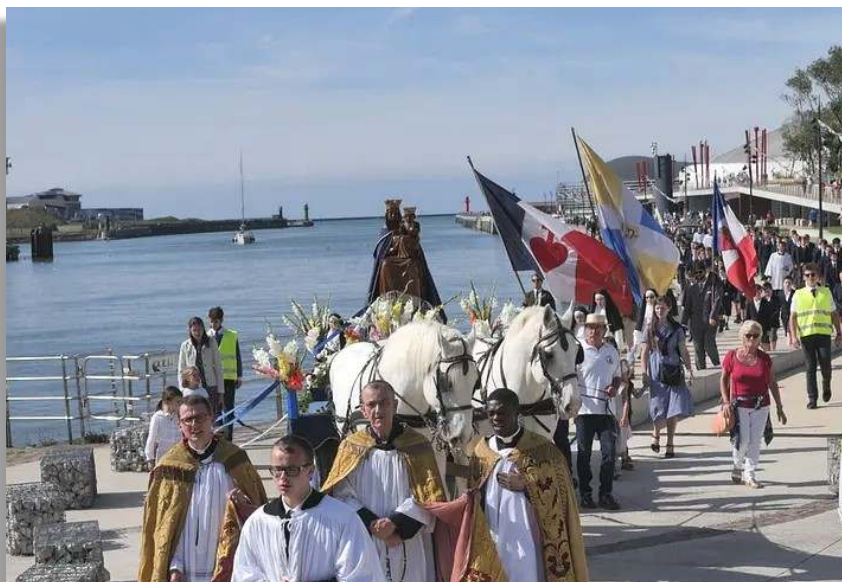
Pèlerinage à Notre-Dame de Boulogne-sur-mer

entre deux conceptions différentes et opposées de l'Église et de la vie chrétienne, absolument irréductibles et incompatibles l'une avec l'autre. Paraphrasant saint Augustin, on pourrait dire que deux messes édifient deux ci-