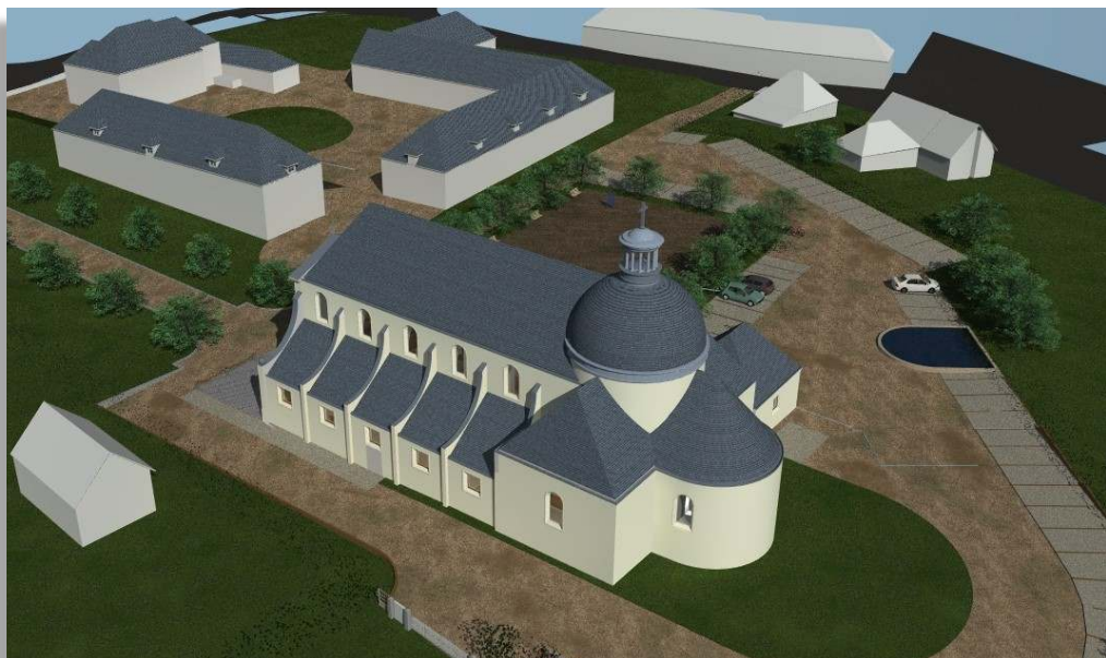
Projet de la nouvelle chapelle à Gavrus

vailer à la sanctification de centaines de fidèles éparpillés autour du prieuré, pour refaire avec eux et en eux une véritable chrétienté. De leur côté,