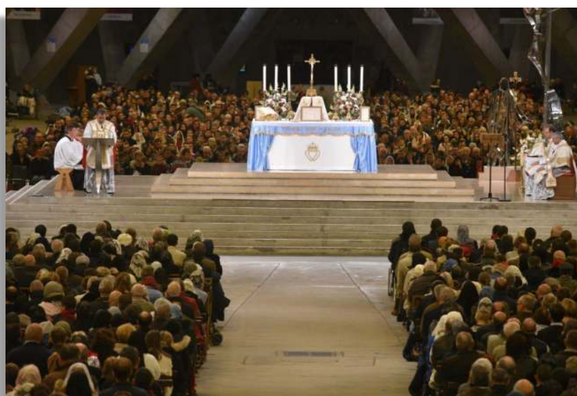
Pèlerinage du Christ-Roi à Lourdes, octobre 2021