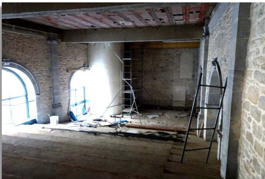
Chapelle de la Visitation à rénover, Besançon

Dans un sens moral et spirituel, bien sûr, et ceci sans aucune réserve. Mais même dans un sens matériel, si cela est possible et autant que cela convient : installer son logement à proximité du prieuré permet de bénéficier de l'apostolat du prêtre avec plus de facilité. Ne négligeons pas ce critère lorsque nous décidons de l'implantation de notre logement (par exemple, au moment de partir à la