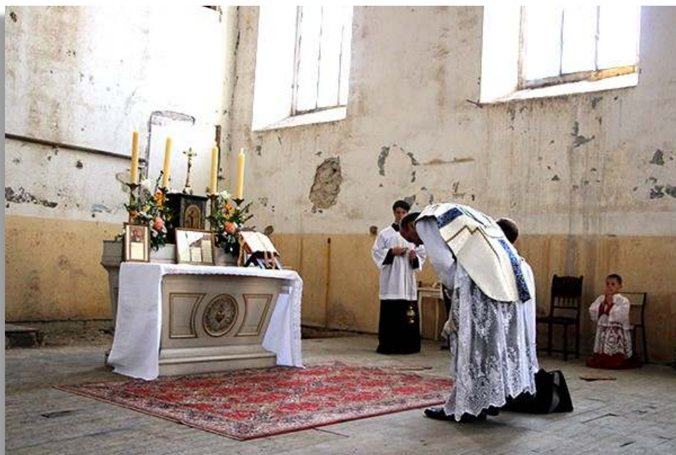
Chapelle de la Visitation à restaurer, Puy-en-Velay

cides), il faut que nous ayons un lien profond, organique, avec notre prieuré. Nous l'avons à travers la chapelle que nous fréquentons, bien sûr, où le prêtre venu du prieuré nous dispense la doctrine et la grâce, mais il convient d'aller plus loin, et de prendre l'habitude de fréquenter le prieuré lui-même, pour nous y ressourcer, y recevoir les conseils adéquats, pour que