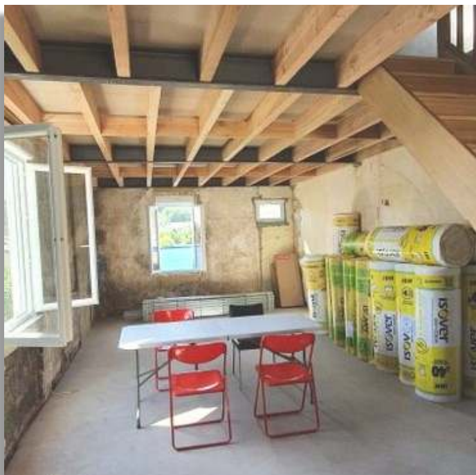
Aménagement du futur presbytère, Périgueux

ces fidèles vraiment catholiques élèvent autour du prieuré comme une muraille de prière, pour que les saints anges protègent leurs prêtres et leurs religieux de toute défaillance, de toute erreur, de tout découragement.