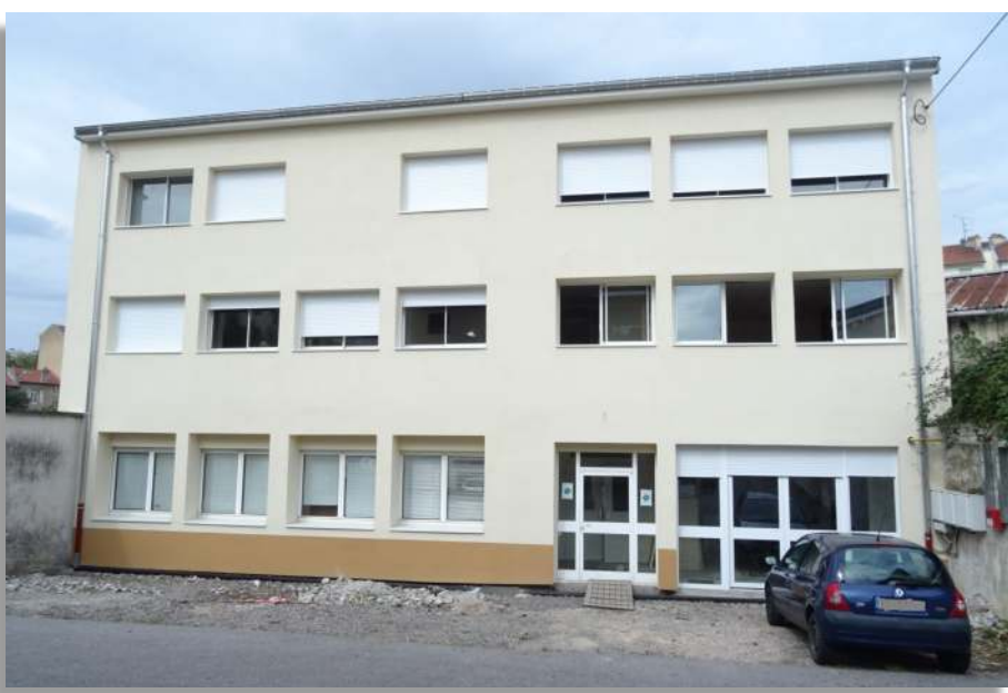
Nouveau prieuré à Vandoeuvre-lès-Nancy

Mais les fidèles, pour leur salut, n'ont pas moins besoin de la vérité que les prêtres. Il est donc aussi nécessaire et opportun que cette vérité étudiée et méditée par le prêtre parvienne jusqu'aux fidèles, par les sermons, les conférences, les bulle-