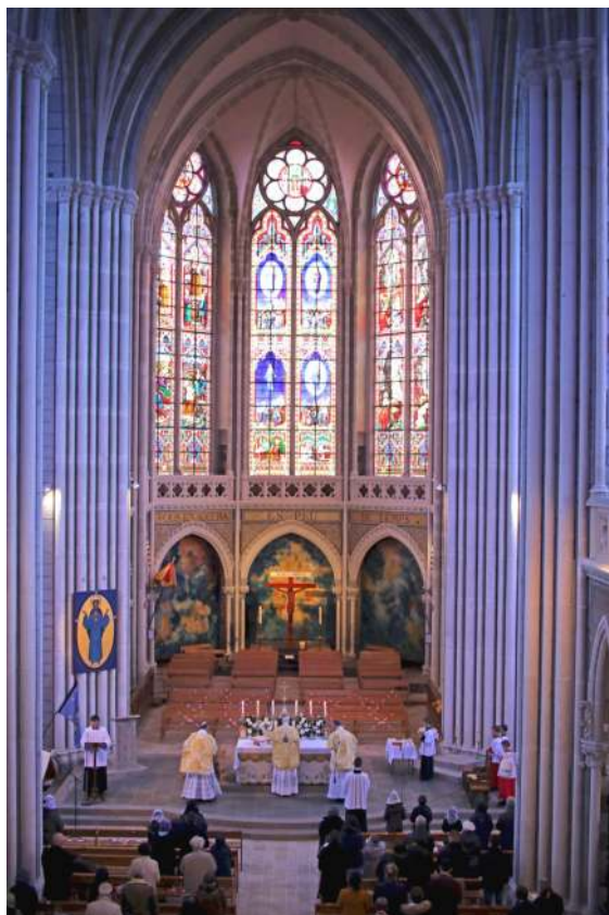
Jubilé de Notre-Dame de Pontmain, 13 mars 2021

La Fraternité Saint-Pie X a le devoir d'aider toutes ces âmes qui