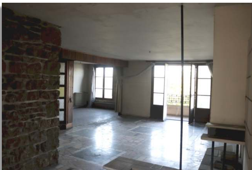
Nouveau prieuré à aménager, Lyon

En particulier, le prieuré est pour les prêtres qui y mènent une vie religieuse nécessaire à leur équilibre (donc aussi nécessaire à votre équilibre) un lieu d'étude, d'approfondissement de la doctrine chrétienne et, autant que de besoin, de la vérité naturelle (la saine philosophie à l'école de saint Thomas, la réalité historique au-delà de tous les travestissements, etc.). Car la Révélation divine englobe, explicite et protège les vérités que peut connaître la raison humaine. Sans la foi, la raison humaine, abîmée par le péché ori-