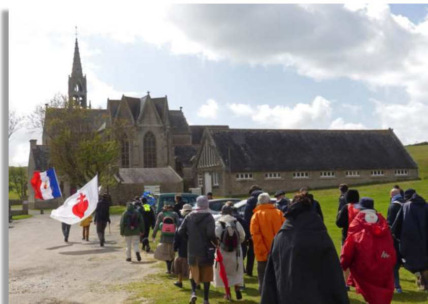
Pèlerinage local de Pentecôte, Sainte-Anne-de-la-Palud, Finistère

Mais pourquoi cette messe est-elle devenue un signe de contradiction à