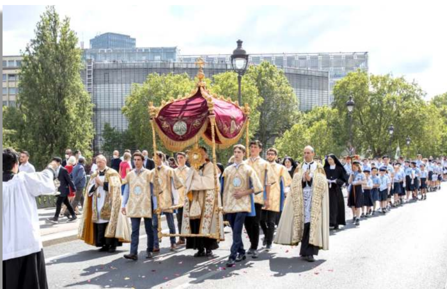
Procession de la Fête Dieu, Paris

tés : la messe de toujours a édifié la cité chrétienne, la nouvelle messe cherche à édifier la cité humaniste et laïque. Si le Bon Dieu permet tout cela, il le fait certainement pour un bien plus grand. Tout d'abord pour nous-mêmes, qui avons la chance imméritée de connaître la messe tridentine et d'en bénéficier ; nous possédons un trésor dont nous ne mesurons pas toujours toute la valeur, et que nous gardons peut-être trop par habitude. Quand quelque chose de précieux est attaqué ou méprisé, on en mesure mieux toute la valeur. Puisse ce « choc » provoqué par la dureté des