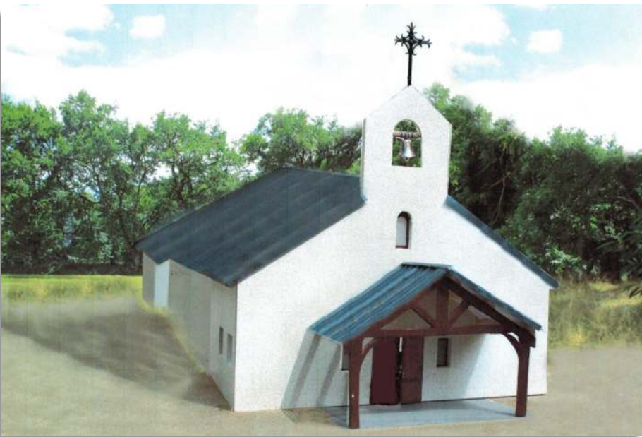
Projet de la nouvelle chapelle à Guer

De son côté, en tant que Fondateur de la Fraternité Saint-Pie X, il organisait ce qui devait être le point névralgique de cette « chrétienté de sur-