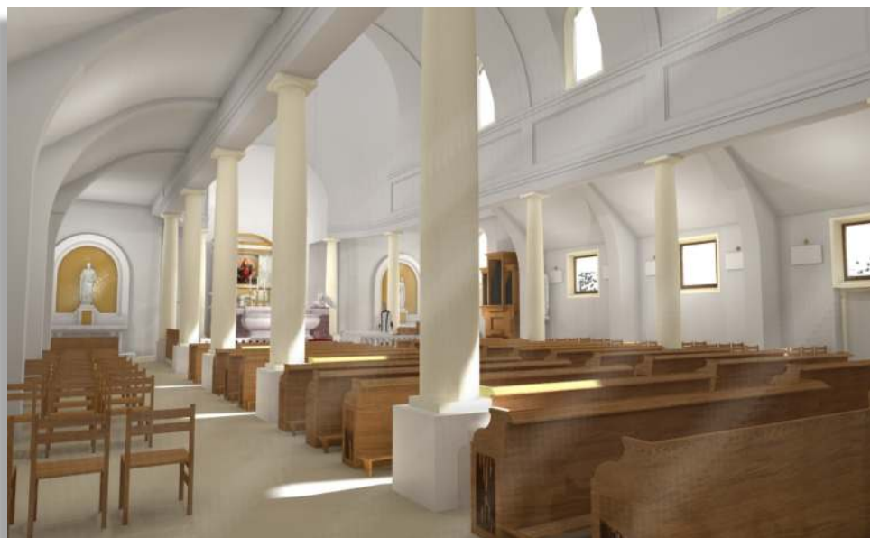
Projet de la nouvelle chapelle à Gavrus