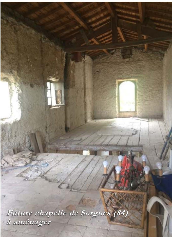
Future chapelle de Sorgues (84) à aménager

poser universellement. En d'autres termes, une expérience-sentiment ne peut pas correspondre à une vérité absolue : sa valeur