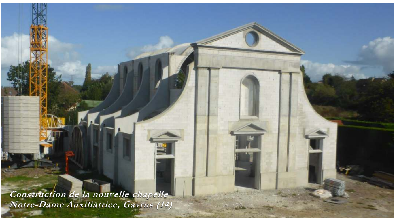
Construction de la nouvelle chapelle Notre-Dame Auxiliatrice, Gavrus (14)

temps de côté ce qui ne serait plus actuel. Ainsi, la foi devient une réalité plutôt humaine, liée comme l'histoire de l'humanité à des contingences toujours nouvelles et changeantes. À la longue, il ne reste plus grand-chose d'éternel, de transcendant, d'immuable. Si on parle encore de Dieu et de l'Eglise, ces deux réalités finissent par être la projection de ce que l'expérience peut ressentir hic et nunc . Ces deux termes,