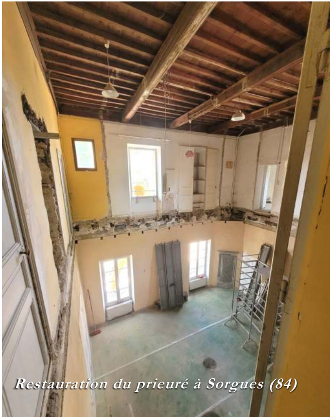
Restauration du prieuré à Sorgues (84)

poser universellement. En d'autres termes, une expérience-sentiment ne peut pas correspondre à une vérité absolue : sa valeur