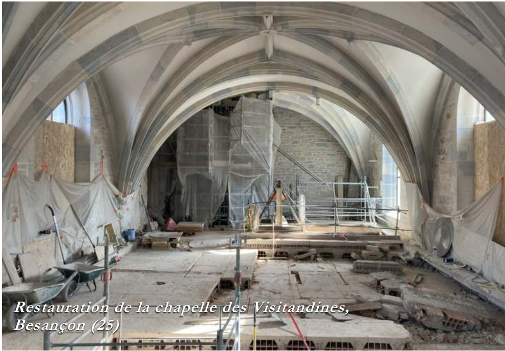
Restauration de la chapelle des Visitandines, Besançon (25)

particulier à l'écoute de toutes les périphéries, c'est-à-dire avec une attention particulière portée à tout ce que les âmes les plus éloignées pourraient suggérer. C'est une Eglise où le pasteur devient brebis et la brebis devient pasteur.