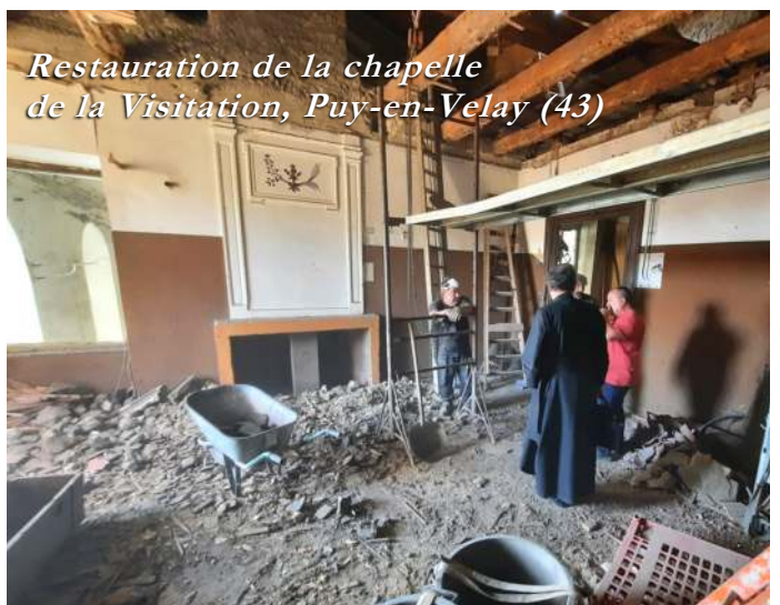
Restauration de la chapelle de la Visitation, Puy-en-Velay (43)

çon d'exercer l'autorité subit le même mécanisme que celui qui régit les démocraties modernes : une chose qui ne peut pas être approuvée aujourd'hui le sera demain, lorsque par la même dialectique, par une nouvelle pression, par de nouveaux précédents, la situation sera suffisamment mûre et les esprits suffisamment préparés. Voilà décrit en quelques mots le mécanisme déclenché par la synodalité, et voilà pourquoi nous nous trouvons devant la figure la plus aboutie du modernisme.