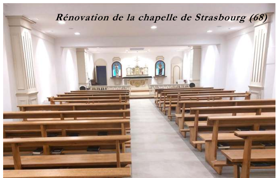
Rénovation de la chapelle de Strasbourg (68)

Le fait de rejeter la distinction entre croyants et non-croyants est certes folle, mais logique dans le contexte actuel : si la foi n'est plus une réalité authentiquement surnaturelle, l'Eglise elle-même, censée la garder et la prêcher, altère sa raison d'être et sa mission auprès des hommes. En effet, si la foi n'est qu'une expérience parmi d'autres, on ne voit pas pourquoi elle serait meilleure, ni pourquoi il faudrait l'im-