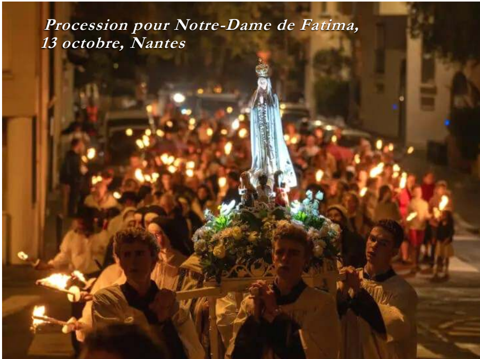
Procession pour Notre-Dame de Fatima, 13 octobre, Nantes

Tout récemment, un rescrit du pape François a rappelé que tout nouveau prêtre qui voudrait célébrer la messe tridentine doit obtenir la permission expresse du Saint-Siège. De plus, si une messe tridentine est autorisée dans une église paroissiale, il faut aussi la permission du Saint-Siège. Comment évaluez-vous ces mesures ?