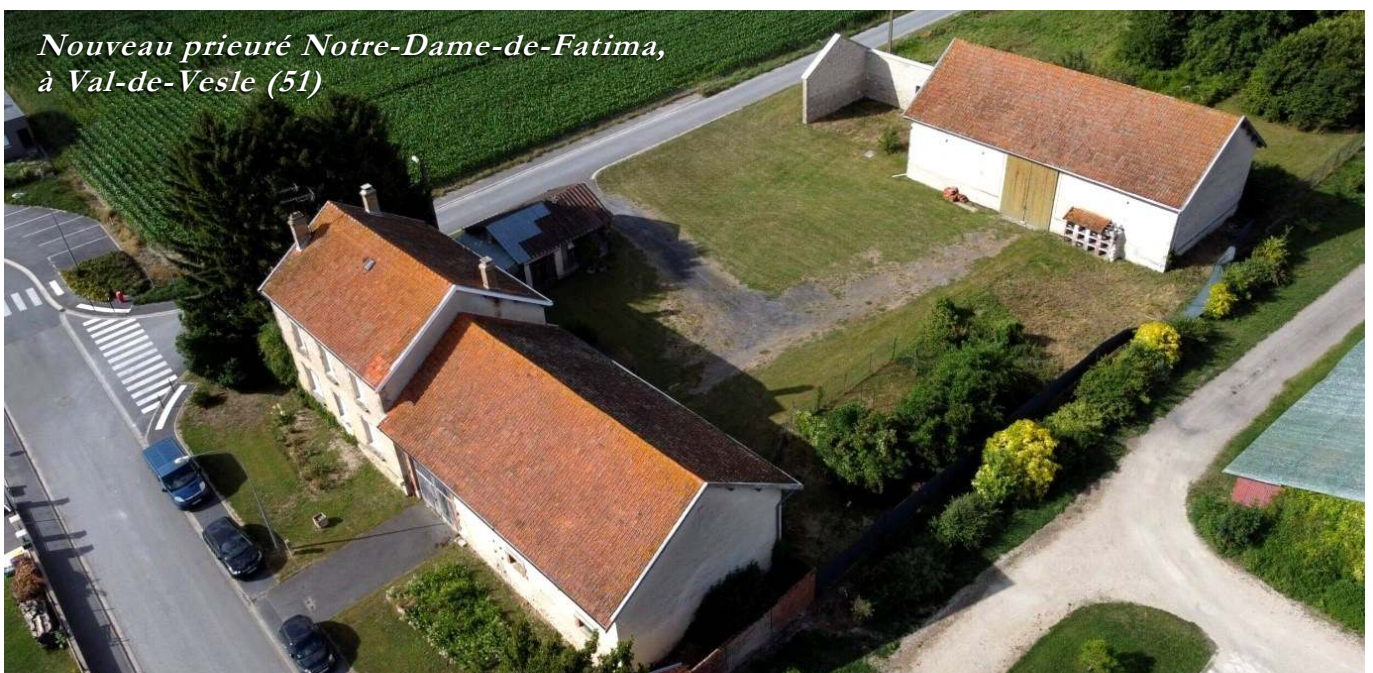
Nouveau prieuré Notre-Dame-de-Fatima, à Val-de-Vesle (51)