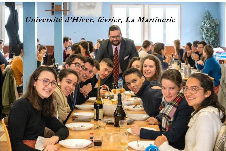
Université d'Hiver, février, La Martinerie

Un prêtre est censé vivre de sa messe sans se demander s'il sera encore autorisé par ses supérieurs à la célébrer demain. Il doit avoir le souci de faire participer