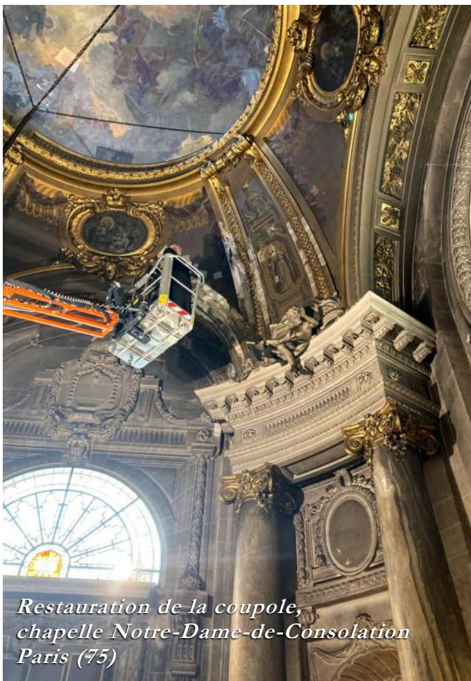
Restauration de la coupole, chapelle Notre-Dame-de-Consolation Paris (75)

Cette idée est à la base même de tout l'édifice moderniste. Saint Pie X construit toute son encyclique Pascendi à partir de la dénonciation de cette fausse idée de la Révélation. Si, au lieu de se référer à la Sainte Ecriture et à la Tradition, on réduit la foi à une expérience – individuelle d'abord, puis communautaire lorsqu'elle est partagée – alors on ouvre le contenu de la foi, et par conséquent la constitution de l'Eglise, à toutes sortes d'évolutions possibles. Une expérience est par définition liée à un moment, à une période : c'est