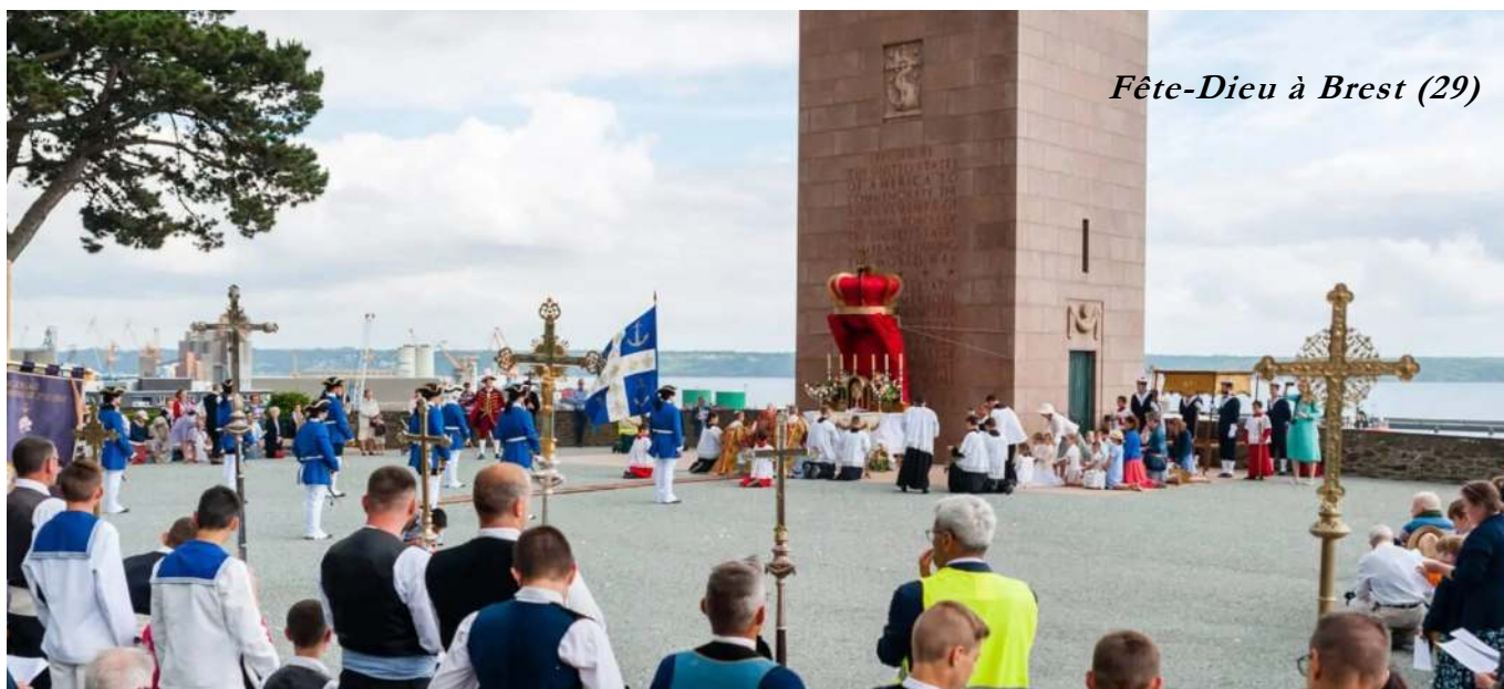
Fête-Dieu à Brest (29)