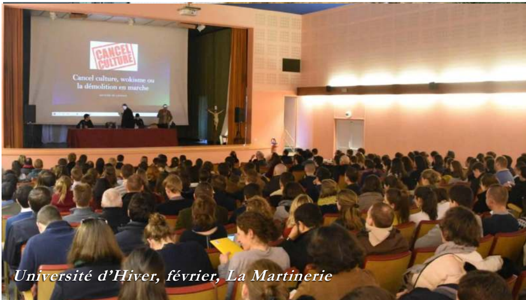
Université d'Hiver, février, La Martinerie

fants, les célibataires, hiérarchiquement organisés, chantent ensemble les louanges de Dieu.