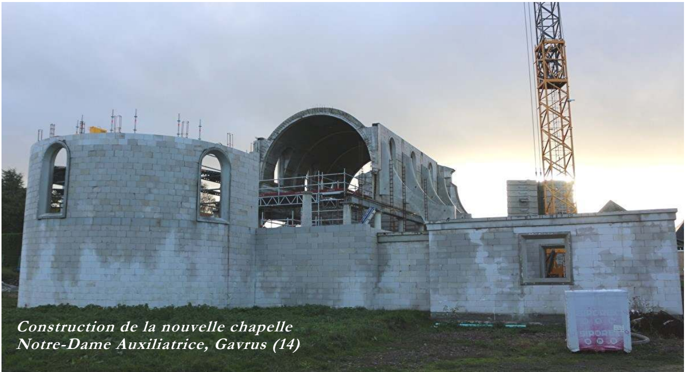
Construction de la nouvelle chapelle Notre-Dame Auxiliatrice, Gavrus (14)

une réalité qui se produit dans le temps et dans l'histoire, et qui donc, par essence, est évolutive. De même que la vie de chacun d'entre nous contient un mouvement, et par conséquent, évolue.