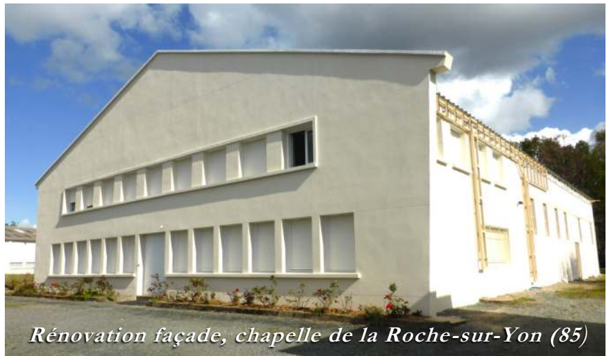
Rénovation façade, chapelle de la Roche-sur-Yon (85)

Effectivement, un deuxième passage me semble bien résumer l'esprit de l'ensemble du texte, et en même temps, le ressenti propre à ces dernières années de pontificat : « Le monde a besoin d'une Eglise en sortie , qui rejette la division entre croyants et non