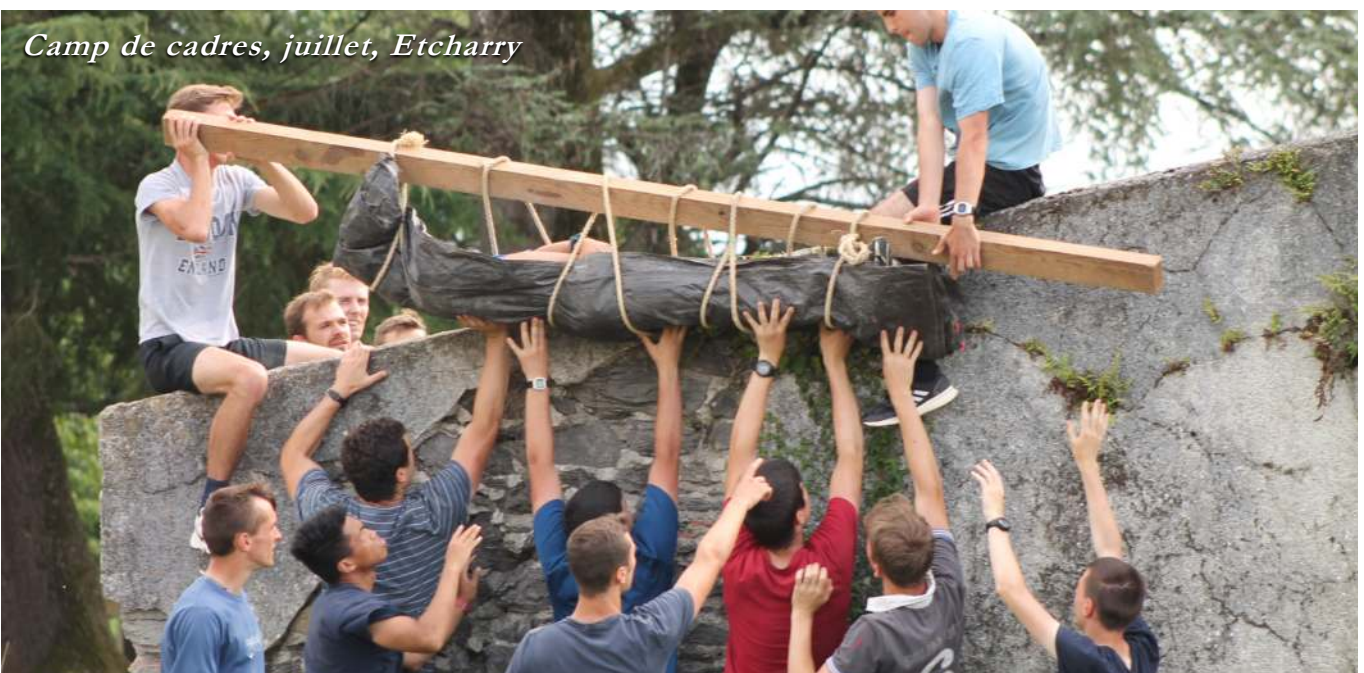
Camp de cadres, juillet, Etcharry

Dans un autre genre, les Universités d'été et d'hiver, qui rassemblent des centaines de participants, se déroulent, certes, dans une atmosphère studieuse, mais la vie en commun qu'elles proposent pendant quelques jours permet de nouer des amitiés chrétiennes. Et pour les jeunes gens qui s'apprêtent à entrer dans la vie et réfléchissent à leur avenir, le camp de cadres, où ils partagent les difficultés et y font face ensemble, est