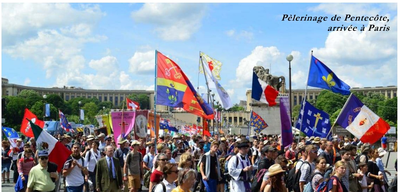
Pèlerinage de Pentecôte, arrivée à Paris

J'attire spécialement votre attention sur nos deux grands pèlerinages annuels, le pèlerinage de marche de Chartres à Paris à la Pentecôte, celui plus « statique » mais non moins fervent de Lourdes au Christ-Roi. Ces deux événements attirent sur les âmes qui y participent des grâces innombrables, mais sont de plus une occasion de vie sociale chrétienne exceptionnelle, tant par les relations personnelles qu'on peut y nouer, que par la participation à une activité d'Église, une réalité visible lorsque le clergé, les religieux et religieuses, les vieux et les jeunes, les familles, les en-