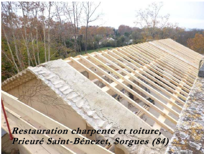
Restauration charpente et toiture, Prieuré Saint-Bénézet, Sorgues (84)

telle fête ne pourrait avoir de portée réelle que si la demande en venait de l'ensemble de l'Eglise : « Sa Sainteté trouvait le projet beau, très grand, très à propos, mais que précisément à cause de sa grandeur et de son importance il méritait une réalisation digne, grandiose, mondiale, qui fasse époque, qui donne un ébranlement aux esprits ; qu'il fallait donc une préparation profonde et étendue des masses, afin que le jour où Sa Sainteté le sanctionnerait, le peuple comprenne la portée de l'acte Pontifical. »