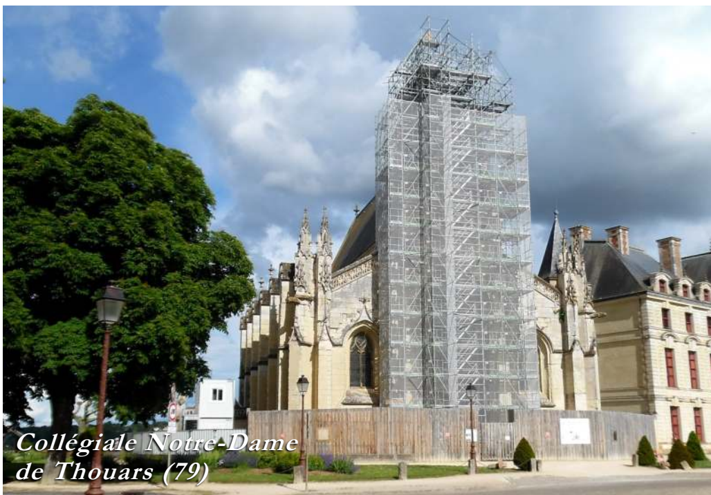
Collégiale Notre-Dame de Thouars (79)

La Fraternité Saint-Pie X a désormais célébré son demi-centenaire. Depuis 1988, elle a plus que triplé son nombre de prêtres, passant de 200 prêtres à 700 prêtres. Elle a multiplié les prieurés, les chapelles, les écoles, mais aussi les œuvres de piété et de doctrine, y compris désormais sur internet où l'on peut trouver des milliers de textes, d'enregis-