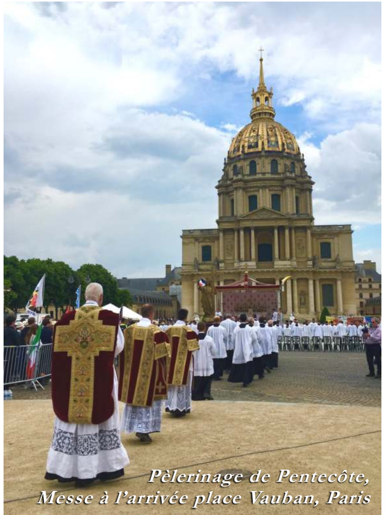
Pèlerinage de Pentecôte, Messe à l'arrivée place Vauban, Paris

N'est-ce pas une réalité tangible que celle de ces jeunes issus de familles pleinement engagées dans le combat de la Fraternité Saint-Pie X, de ces jeunes n'ayant fréquenté que les chapelles et les écoles de la Fraternité Saint-Pie X, et que l'on découvre un jour chrétiens,