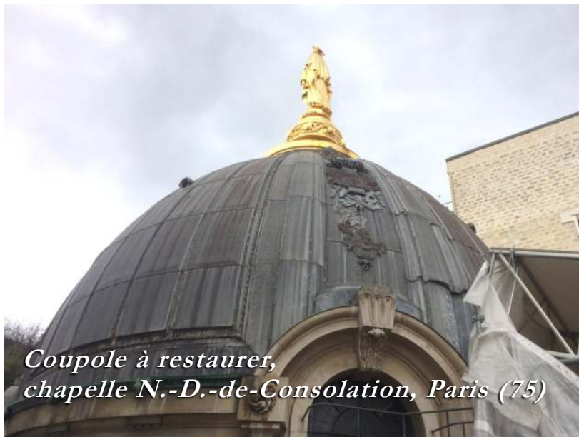
Coupole à restaurer, chapelle N.-D.-de-Consolation, Paris (75)

telle fête ne pourrait avoir de portée réelle que si la demande en venait de l'ensemble de l'Eglise : « Sa Sainteté trouvait le projet beau, très grand, très à propos, mais que précisément à cause de sa grandeur et de son importance il méritait une réalisation digne, grandiose, mondiale, qui fasse époque, qui donne un ébranlement aux esprits ; qu'il fallait donc une préparation profonde et étendue des masses, afin que le jour où Sa Sainteté le sanctionnerait, le peuple comprenne la portée de l'acte Pontifical. »