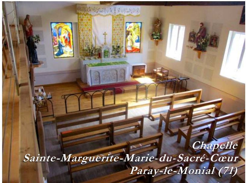
Chapelle Sainte-Marguerite-Marie-du-Sacré-Cœur Paray-le-Monial (71)

A l'heure où l'amour infini du Dieu fait homme est méconnu ou déformé ; à l'heure l'on n'entend que trop ce cri « de la foule infidèle » dont parle la liturgie du Christ-Roi : « Nous ne voulons pas qu'il règne sur nous » ; à l'heure où le Président de la Conférence des évêques de France, dans la suite du dernier Concile, explique que c'est perdre son énergie que « de traîner la nostalgie d'un état catholique », la Fraternité Saint-Pie-X – aussi appelée « Société des apôtres des Cœurs de Jésus et Marie » – ne peut pas omettre de célébrer comme il convient ce double jubilé à Paray-le-Monial, fidèle au mot d'ordre de Quas Primas : « Plus les réunions internationales et les assemblées nationales accablent d'un indigne silence le nom très doux de notre Rédempteur, plus il faut l'acclamer et faire connaître les droits de la dignité et de la puissance royale du Christ. » Ces anniversaires seront pour chacun d'entre-nous l'occasion de mieux vivre la royauté du Sacré-Cœur sur nos âmes, sur nos familles, et de re-