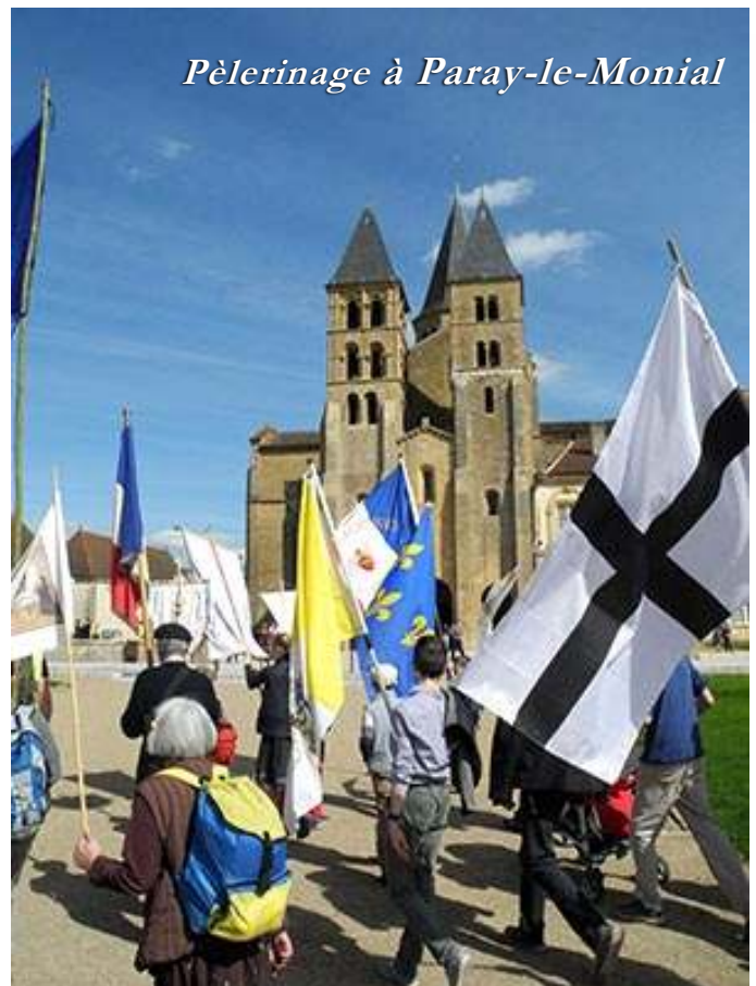
Pèlerinage à Paray-le-Monial

Jubilés 2025 à Paray-le-Monial : Dimanche 2 mars 2025 informations à venir