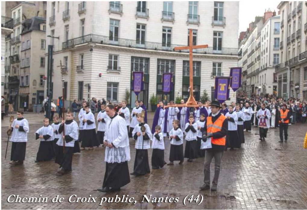
Chemin de Croix public, Nantes (44)

tèrent fidèles, et moins de 20 % qui crurent devoir se séparer.