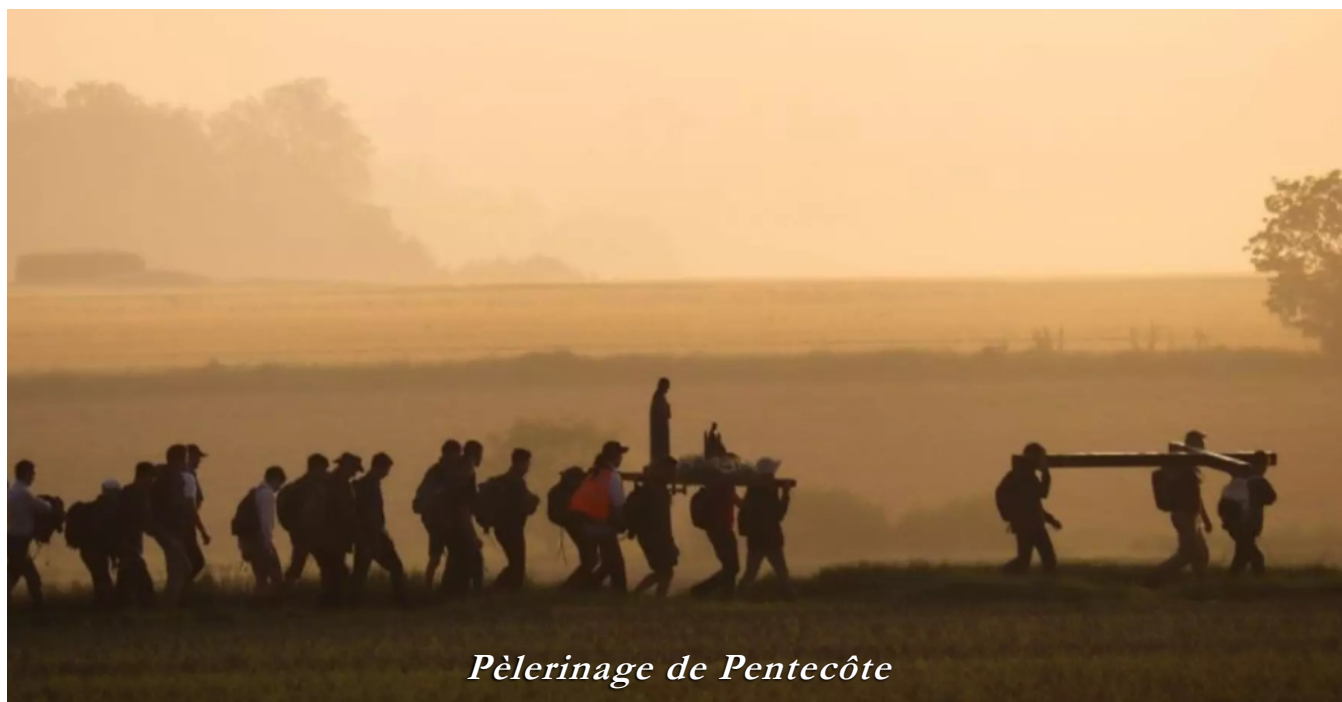
Pèlerinage de Pentecôte